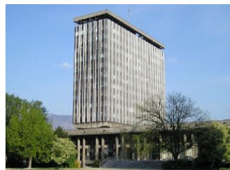
Figure 1 : Hôtel de ville de Grenoble. Bâtiment instrumenté par le RESIF-RAP.

Comme pour les stations en champ-libre, le parti pris par le RESIF-RAP a été de déployer des systèmes sensibles, ayant une grande dynamique et permettant l'enregistrement de signaux d'amplitude faible à forte.