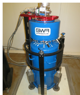
Figure 3. Modèle iOSG de GWR Instruments dont l'installation à Strasbourg est prévue en 2015.

Le projet RESIF va permettre une jouvence de notre gravimètre en 2015. Un instrument de type iOSG de GWR (Fig. 3) a été choisi en raison de ses performances instrumentales; en effet, la sphère en lévitation sera non seulement plus lourde (18g au lieu de 4g actuellement) mais aura aussi un amortissement du mode propre moins fort, ce qui permettra de diminuer fortement le bruit thermique instrumental (Fig. 2), avec en ligne de mire la détection de signaux en provenance de l'intérieur profond de la Terre qui sont d'amplitude très faible (quelques nanogals au plus) comme la translation de la graine solide au sein du noyau fluide (modes de Slichter).