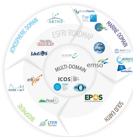
Figure 1 : les infrastructures européennes de recherche dans le cadre de ENVRI+

EPOS (European Plate Observing System) est une des infrastructures européennes créées ces dernières années, dédiée à l'observation et l'étude du système Terre et de ses différents compartiments : géosphère,