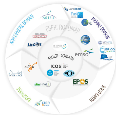
Figure 1 : les infrastructures européennes de recherche dans le cadre de ENVRI+

EPOS (European Plate Observing System) est une des infrastructures européennes créées ces dernières années, dédiée à l'observation et l'étude du système Terre et de ses différents compartiments : géosphère,