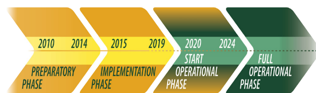
Figure 4 : calendrier pour créer EPOS

Les équipes françaises sont fortement mobilisées pour construire et porter des services de EPOS. Le point