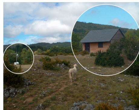
Fig.1) L'observatoire GEK (zoom à droite), abrite un gravimètre supraconducteur (iGrav) depuis 2011. Un sismomètre large bande a également été hébergé pendant un an (2015) en attendant une

future station permanente de RESIF. A l'extérieur, deux pluviomètres au auget et une tour de flux (zoom de gauche) permettent d'obtenir des mesures météorologiques précises et locales.