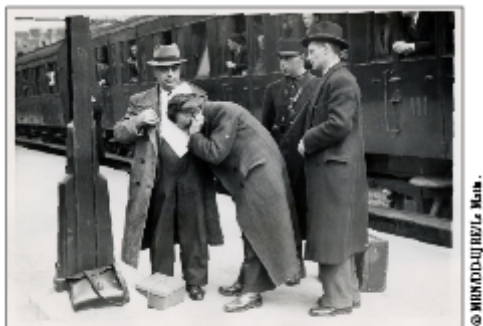
Visite médicale sur le quai d'embarquement d'Austerlitz avant le transfert des rafles vers Pithiviers et Beaune-la-Rolande (Loiret). Photo Maurice Le Chapelain pour « Le Matin », 14 mai 1941.

Sur la série de photographies prises pour Le Matin à l'arrivée à la gare d'Austerlitz, les hommes qui s'avancent vers le train portent de petites malles. La convocation les invitait en effet à se présenter accompagné d'un membre de leur famille ou d'un ami, par la suite prié d'aller chercher pour eux quelques effets personnels - vêtements et vivres. Certains détournent la tête ou se cachent, d'autres sourient à l'objectif. Une photographie - dont la composition étudiée laisse à penser qu'elle a été mise en scène - figure un simulacre de visite médicale précédant l'embarquement. Légendée au verso « Un juif passe la visite médicale sur le quai, avant le départ », cette photographie n'a cependant pas été publiée par le journal. Elle peut être vue comme le média d'une propagande savamment orchestrée.