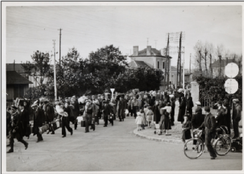
Arrivée des raflés à Pithiviers. Photo Maurice Zalewski pour « Le Matin », 14 mai 1941.