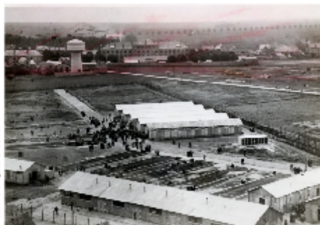
© MUSEUM D'ART ET D'HISTOIRE DE PITHIVIERS Vue du camp d'internement de Pithiviers. Photo Maurice Zaleski pour « Le Matin », 16 [?] mai 1941.

surveillance du camp est en effet assurée par des gendarmes de la région parisienne, des douaniers repliés du Sud-Ouest et des gardiens auxiliaires recrutés localement. L'enregistrement est par ailleurs un épisode marquant pour nombre d'internés qui reviennent sur cette scène à travers leurs témoignages et leurs créations [37] .