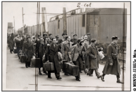
Arrivée des rafles du billet vert sur le quai d'embarquement d'Austerlitz sous la supervision de gardes mobiles français. 14 mai 1941.

Sur la série de photographies prises pour Le Matin à l'arrivée à la gare d'Austerlitz, les hommes qui s'avancent vers le train portent de petites malles. La convocation les invitait en effet à se présenter accompagné d'un membre de leur famille ou d'un ami, par la suite prié d'aller chercher pour eux quelques effets personnels - vêtements et vivres. Certains détournent la tête ou se cachent, d'autres sourient à l'objectif. Une photographie - dont la composition étudiée laisse à penser qu'elle a été mise en scène - figure un simulacre de visite médicale précédant l'embarquement. Légendée au verso « Un juif passe la visite médicale sur le quai, avant le départ », cette photographie n'a cependant pas été publiée par le journal. Elle peut être vue comme le média d'une propagande savamment orchestrée.