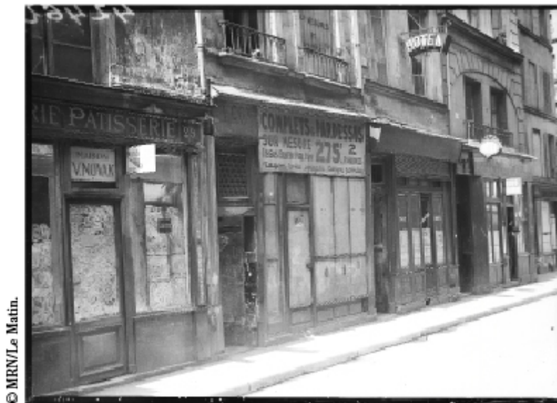
Affiches « 1 er Mai » de l'État français placardées sur la devanture d'un commerce juif dans le quartier Saint-Paul. 19 mai 1941.

l'article 4 de cette même ordonnance, stipulant que « tout commerce dont le propriétaire ou le détenteur est juif devra être désigné comme entreprise juive par une affiche spéciale en langues allemande et française », son application est visible sur cette série de photographies.