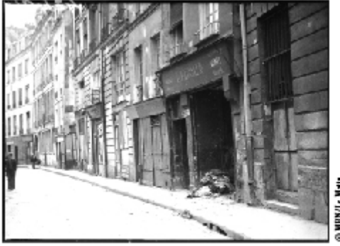
Affiche « Judisches Geseft » placardée sur la devanture d'un commerce juif dans le quartier Saint-Paul, à Paris. 19 mai 1941.