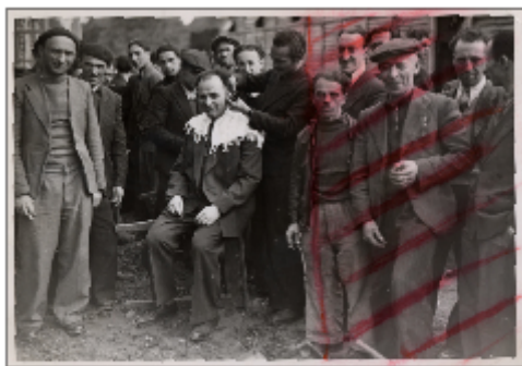
Camp de Pithiviers, assis sur une table renversée, un homme se fait couper les cheveux par un autre interné. Ils sont entourés d'une foule curieuse posant pour le photographe. Photo Maurice Zalewski pour « Le Matin », 16 [?] mai 1941.

Il est bien évident que si Le Matin a pu réaliser un tel reportage, c'est uniquement avec l'aval des services de censure et de propagande allemands. Chaque semaine, la section Presse de la Propaganda-Staffel organise à l'hôtel Majestic, siège du MBF, des conférences auxquelles doivent se rendre ou se faire représenter les directeurs des journaux. Ils y reçoivent les directives et les communiqués officiels. Un censeur est par ailleurs détaché par la Propaganda-Staffel auprès de chaque journal paraissant en zone nord. Dès juillet 1940, un certain Pistaffa-Heinrichs [43] est placé auprès des services du Matin pour contrôler étroitement la rédaction.