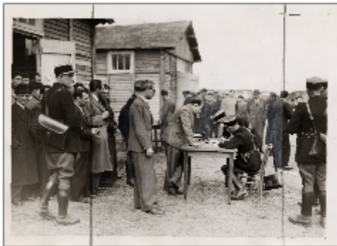
Enregistrement des raflés à l'entrée du camp d'internement de Pithiviers. 14 mai 1941.

Une seconde série de clichés du Matin conservée par le Musée de la Résistance nationale compte sept photographies, exclusivement consacrées à l'ouverture du camp d'internement de Pithiviers. En l'état actuel du traitement des négatifs du Matin, il ne semble pas y avoir eu de reportages photographiques réalisés par ce journal à Beaune-la-Rolande ou dans le cadre des chantiers extérieurs au camp (fermes de la Beauce et Sologne, sucrerie de Pithiviers, râperie à betterave d'Engenville et Mainvilliers, etc.) où les internés ont servi de main-d'œuvre.