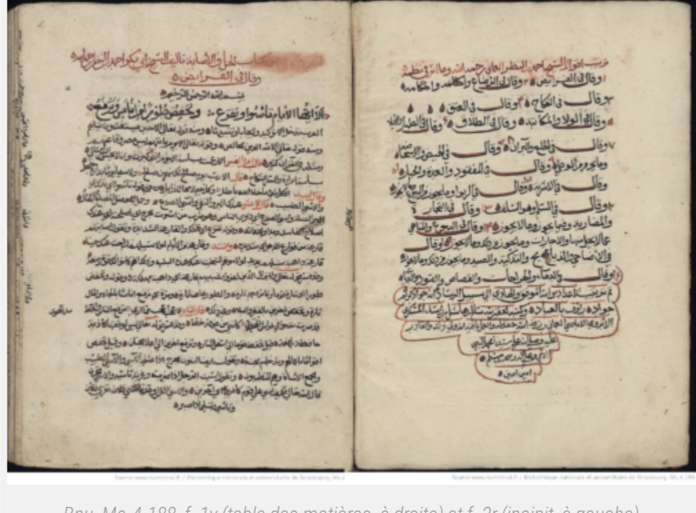
Bnu, Ms. 4.188, f. 1v (table des matières, à droite) et f. 2r (incipit, à gauche)

Il nous surprend par son style littéraire : on découvre un ouvrage de droit islamique faisant un usage inédit de la poésie arabe. L'ouvrage, numérisé et visible sur Numistral , pourra faire l'objet d'un examen plus détaillé.