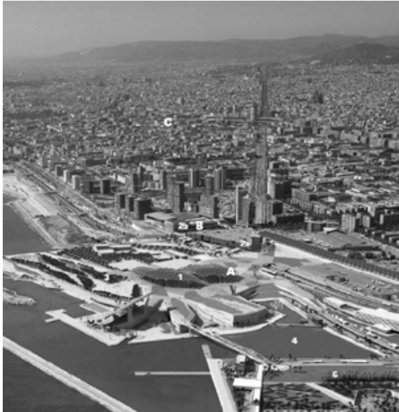
A/ La place Forum, B/ Le complexe des salles de congrès, C/ Poble nou, vers le centre ville 1/Pergola photovoltaïque, 2a/Palais Forum, 2b/Centre de Convention, 3/Les dunes de béton, 4/Marina, 5/Plage du Besòs

Les lieux de culture et de fête de la ville se trouvent associés au Forum. D'ailleurs, c'est certainement grâce au Carnaval du célèbre chanteur et percussionniste brésilien Carlinhos Brown que la fête frémit, lors de l'inauguration, au cœur de Barcelone, sur le Passeig de Gràcia, la grande avenue de la ville ; c'est le spectacle gratuit qui attire le plus de monde (plus de 400.000 personnes). Pour un jour, Barcelone change son nom et devient « Carnacelona » (Figures 4a et 4b).