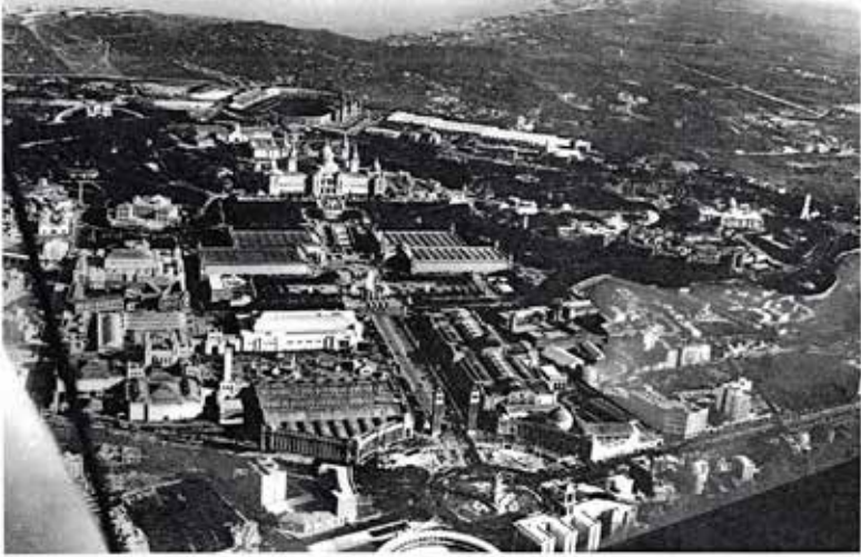
Foto Aerea de la Exposición Die Aeriens der Exposition Aerial view of the Exhibition Abstrich der Ausstellung aus der Vogelperspektive

d'une délégation barcelonaise associée aux délégués généraux représentants de l'Espagne au BIE pour savoir s'il est possible d'organiser à nouveau une exposition internationale à visée universaliste, dans le cadre d'une grande politique de régénération urbaine. La mairie rappelle les précédents de l'exposition universelle de 1888 et de l'exposition internationale de 1929 (Figure 1).