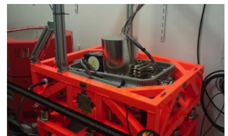
Gravimètre absolu à atomes froids GIRAPE 2 (ONERA) en test sur un navire du SHOM.