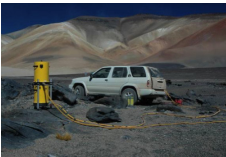
Gravimètre absolu A10 en opération de terrain dans les Andes chiliennes (4500m).