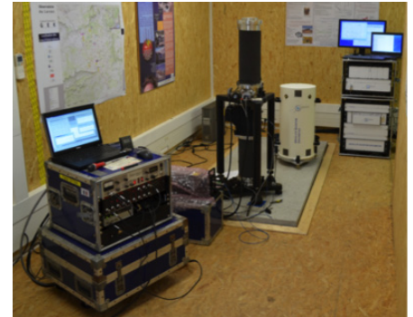
Gravimètre absolu FG5 et gravimètre absolu à atomes froids (AQG) lors d'une campagne d'intercomparaison à l'Observatoire H+ du Larzac.