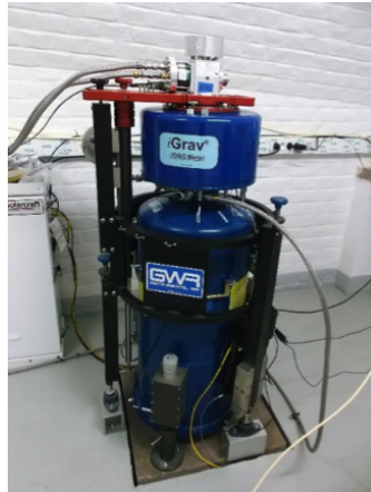
Gravimètre relatif supraconducteur iOSG à l'Observatoire Gravimétrique de Strasbourg.