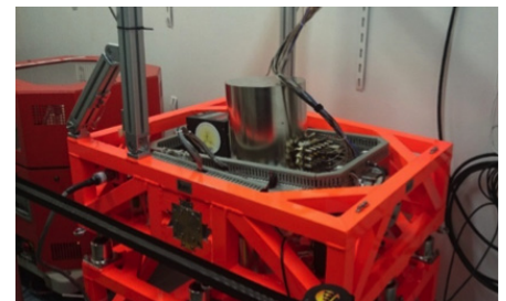
Gravimètre absolu à atomes froids GIRAFA 2 (ONERA) en test sur un navire du SHOM.