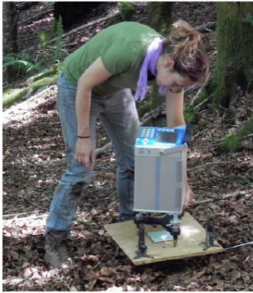
Gravimètre relatif Scintrex CG5 sur un site d'étude microgravimétrique dans les Pyrénées.