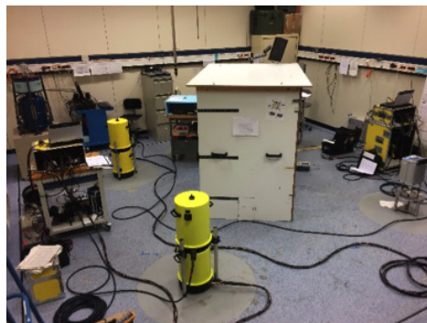
Intercomparaison de gravimètres absolus sur le site LNE de Trappes (au centre : gravimètre absolu à atomes froids CAG).