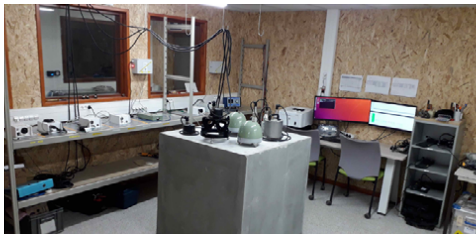
2 – Plateforme ISTerre

ISTerre disposant d'un pilier sismologique dans une salle dédiée, le Sig a mis en place