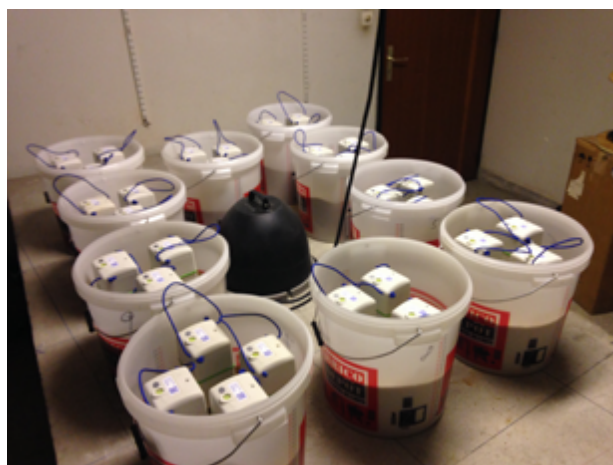
1 – Nodes sur la plateforme Eost