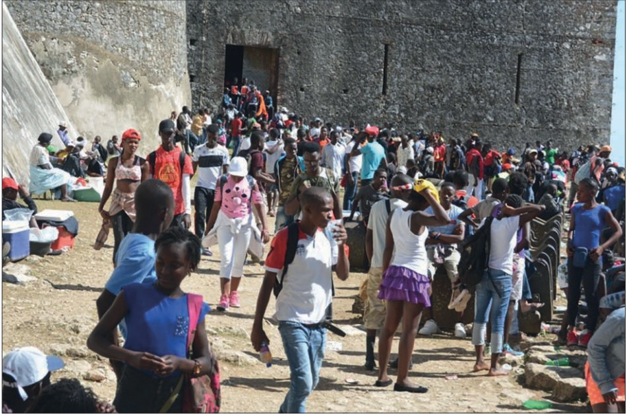
Figure 4 – La semaine sainte, un rendez-vous annuel à la Citadelle Henry, spécialement pour les jeunes haïtiens