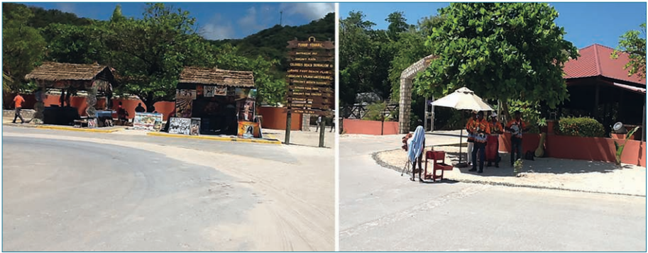
Figures 6 et 7 – Commerce de produits artisanaux et animateur au site de Labadie