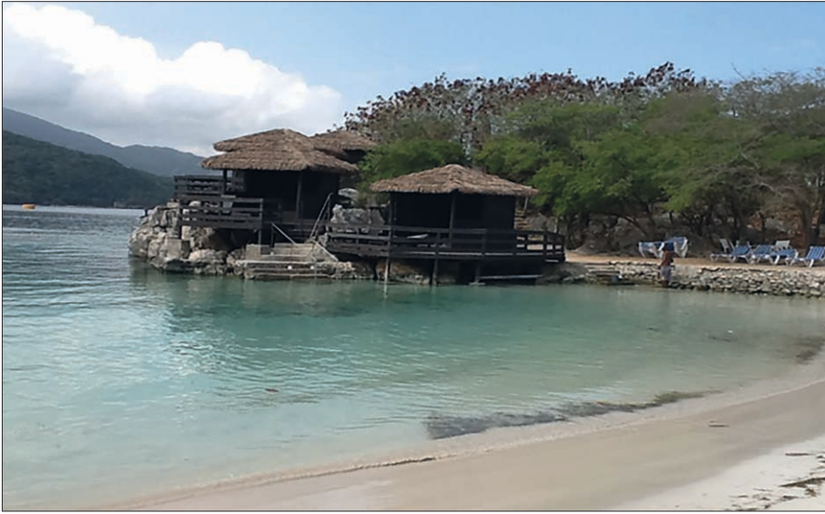
Figure 5 – Les installations de plage pour accueillir les croisiéristes : le décor est planté : eaux transparentes et calmes, sable blanc. Cette plage privée ne s’anime qu’avec l’arrivée des paquebots de croisière

fonctionne comme une enclave, permettant aux excursionnistes des navires de croisière de profiter des plaisirs d'une plage tropicale : les parasols, le marché créole où l'on achète de l'art haïtien et la location d'engins de plage donnent les saveurs d'un tourisme de séjour. L'enclave se perçoit par la présence de clôtures et de gardes armés, les relations avec les populations locales sont limitées et réservées aux personnes autorisées (commerçants et employés du site) à franchir ces limites.