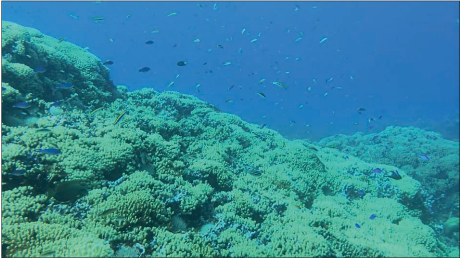
Figure 3 – Des coraux en bonne santé dans les eaux côtières de la baie de Fort-Liberté

Tenant compte de l'importance du patrimoine naturel des baies de Caracol et de Fort-Liberté, le gouvernement haïtien, à travers un arrêté présidentiel du 21 mars 2014, a créé l'« Aire Protégée de Ressources Naturelles Gérées des Trois Baies ». Elle comprend les baies de Limonade, de Caracol, de Fort-Liberté et le Lagon aux Bœufs. Elle s'étend sur une superficie de 75 618 ha qui englobent une partie terrestre et la zone côtière spécifiquement ( Figure 2 ). Il faut rappeler que, dès 1997, la baie de Fort-Liberté a été proposée comme aire à protéger par Ménanteau et Vanney (1997), mais c'est en 2014 que le décret présidentiel a été pris pour sa création.