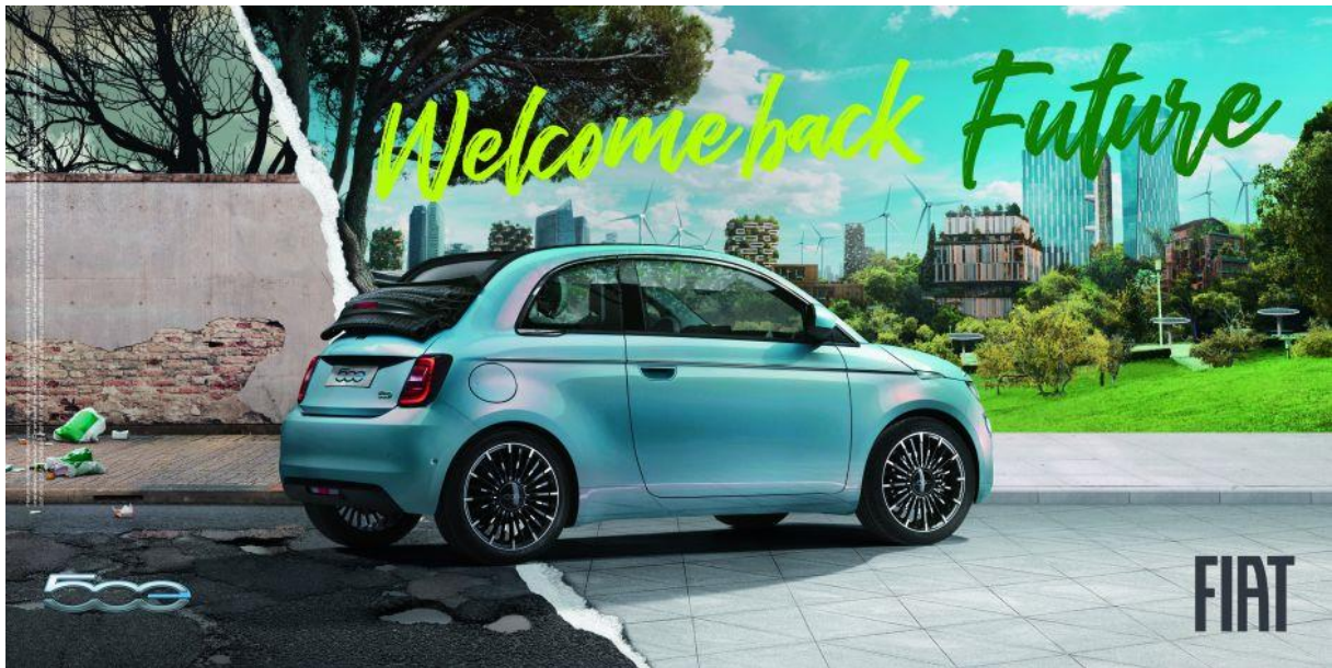
FIAT, Welcomeback Future James Gray réalisateur, Indiana Production, 2021. Publicité TV et affiche promotionnelle.