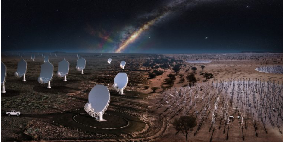
Fig. 1 Réseaux de paraboles (à gauche) et d'antennes (à droite) de l'Observatoire SKA déployés respectivement en Afrique du Sud et en Australie