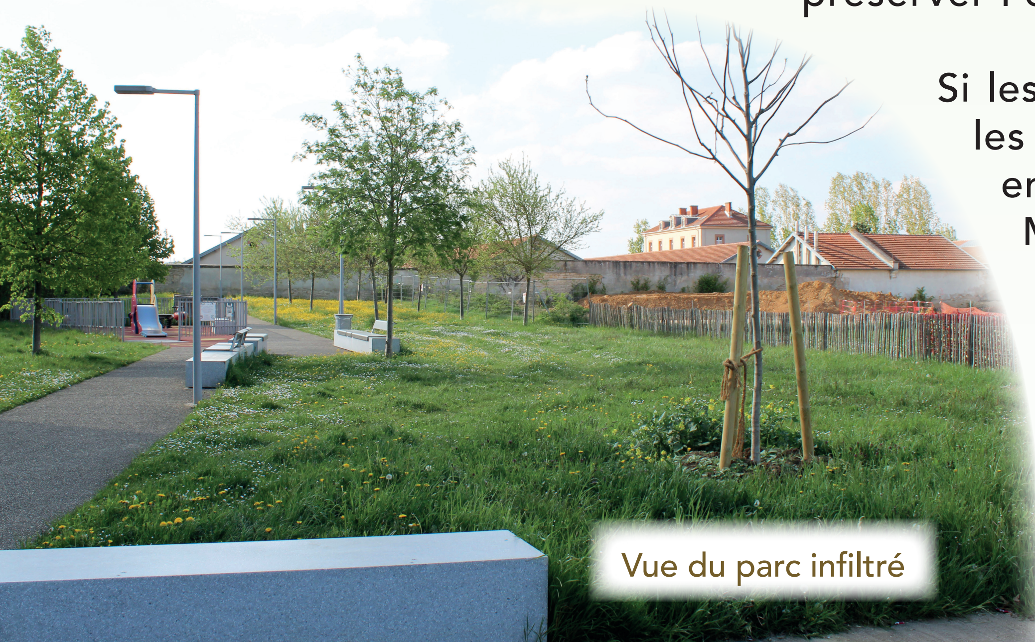
Vue du parc infiltré

Ce dialogue entre ville et nature invite à une réflexion plus globale sur les modes de circulation, la proximité des emplois et des services, sur la « ville du quart d'heure ».