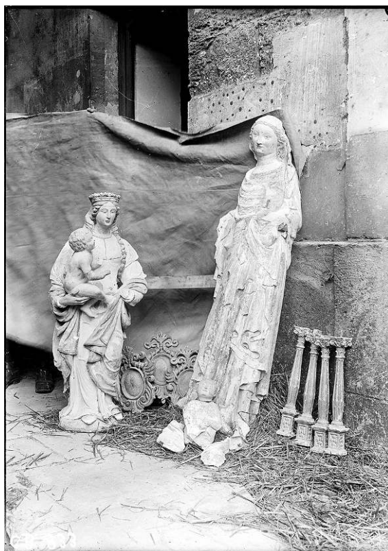
6. Opérateur CB [Maurice Bauche], Statues et objets d'art évacués de l'église de Saint-Martin-aux-Bois : à Compiègne, des œuvres d'art évacuées des villages voisins sont réunies avant leur mise en place dans des endroits protégés, Compiègne, 25 mai 1918, négatif sur plaque de verre, 18 x 13 cm, Ivry-sur-Seine, Ecpad (CB833).

La Grande Guerre a ainsi vu un important mouvement de circulation d'œuvres d'art en France, devenues des « témoins » à l'arrière du drame qui se jouait sur le front. Transporter des œuvres d'art en temps de guerre suppose de concilier une logistique militaire exclusivement tournée vers l'alimentation du conflit et la sauvegarde de biens considérés comme non essentiels sur le plan militaire. La situation de guerre semble faire évoluer le statut de l'œuvre, dont les caractéristiques matérielles priment sur les valeurs qu'elle incarne. Le transport d'œuvres d'art relève ainsi d'une logistique en marge, à rebours de celle visant à alimenter l'effort de guerre, dont l'étude conduit cependant à repenser la perméabilité des fronts et des arrières : ces œuvres qui circulent à contre-courant des hommes, présentes dans les dépôts, parfois exposées, deviennent des points de contact entre les deux zones.