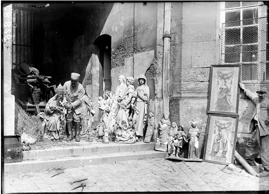
5. Opérateur CB [Maurice Bauche], Étiquetage des œuvres d'art évacuées des villages voisins : à Compiègne, des œuvres d'art évacuées des villages voisins sont réunies avant leur mise en place dans des endroits protégés , Compiègne, 24 mai 1918, négatif sur plaque de verre, 13 x 18 cm, Ivry-sur-Seine, Ecpad (CB826).

La Vierge de Saint-Martin-aux-Bois, certainement déplacée comme celle de Monchy-Humières, parvient au dépôt de Compiègne le 24 mai 1918, à vingt-cinq kilomètres de Saint-Martin-aux-Bois, où elle est étiquetée par un des soldats de la section avant son départ en chemin de fer vers l'arrière, comme l'illustre une photographie issue du même reportage ( fig. 5 ). Un premier numéro est ainsi attribué à l'œuvre à son arrivée au dépôt transitoire, avant qu'un autre ne le lui soit au dépôt de l'arrière. On distingue ici, au centre, à droite de la porte, la Vierge photographiée au Panthéon adossée au mur.