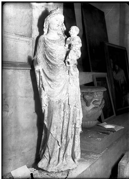
1. Opérateur X [Joly], Panthéon, statue de pierre , Paris, mars 1919, négatif sur plaque de verre, 18 × 13 cm, Ivry-sur-Seine, Ecpad (X3432).

Jusqu'en 1917, seuls quelques musées sont évacués 23 . Chaque évacuation en zone des armées doit faire l'objet d'une demande de moyen de transport auprès du ministère de la Guerre ou du Grand Quartier général puis d'une demande de permis de circulation pour le personnel envoyé en mission 24 . Les Beaux-Arts, ne disposant pas de personnel habilité à travailler dans cette zone ni spécialisé dans les évacuations 25 , sont contraints