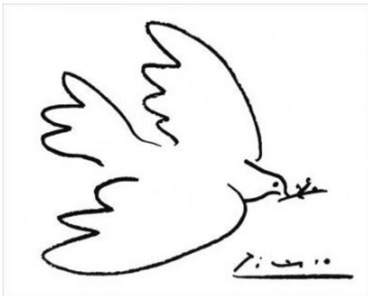
Doc 2. La « Colombe de la Paix » de Picasso (1949).