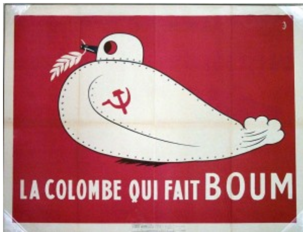
Doc. 3. « La colombe qui fait BOUM », affiche du mouvement anti-communiste français « Paix et Liberté », 1950.