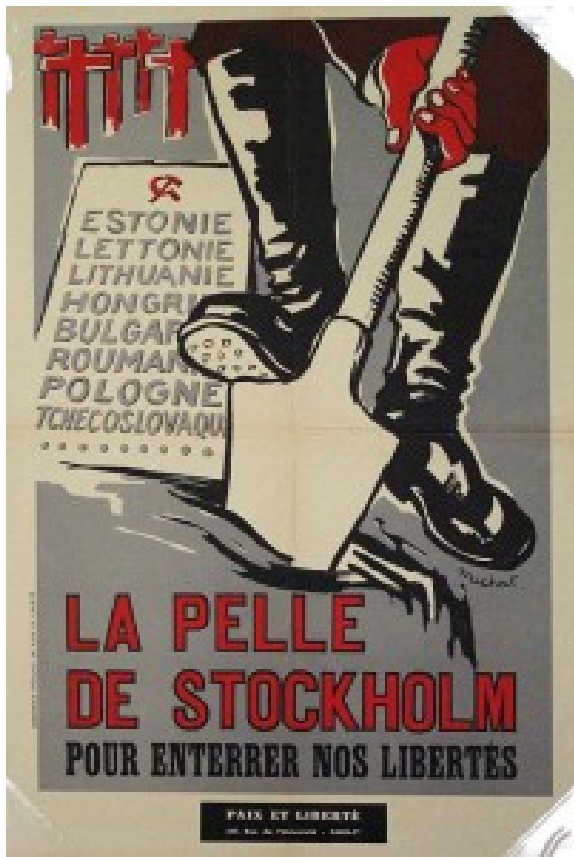
Doc. 5. « La Pelle de Stockholm », affiche du mouvement anti-communiste français « Paix et Liberté ».