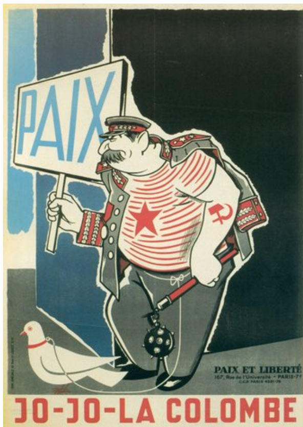
Doc. 4. « Jo-Jo la Colombe », affiche du mouvement anti-communiste français « Paix et Liberté », 1951.