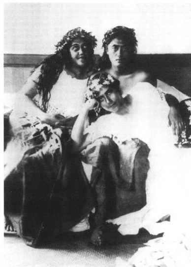
Tahiti. Femmes indigènes.