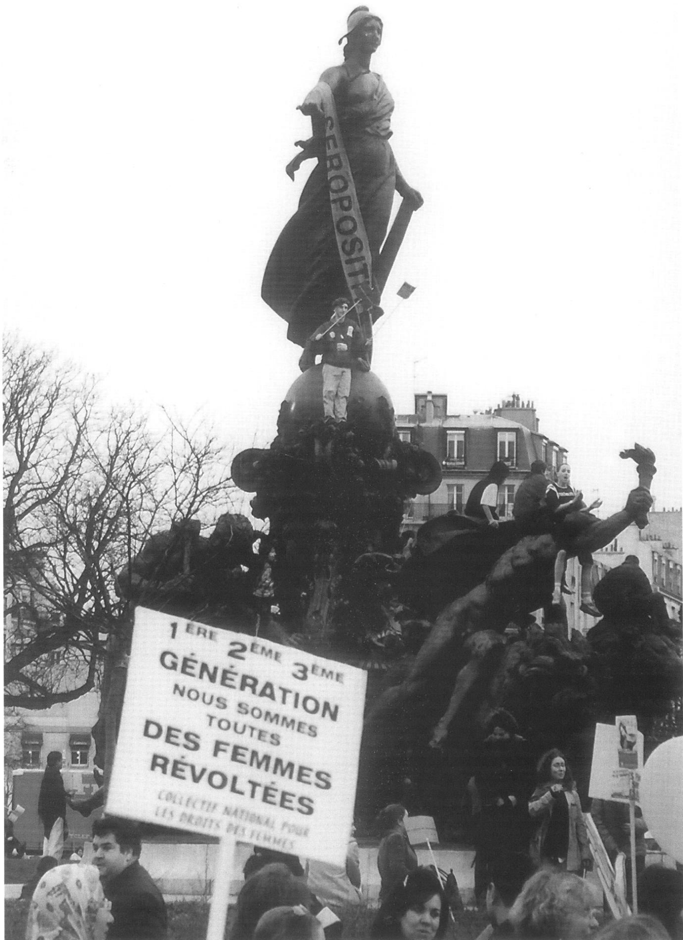
Manifestation de la journée des femmes, 2 mars 2003.