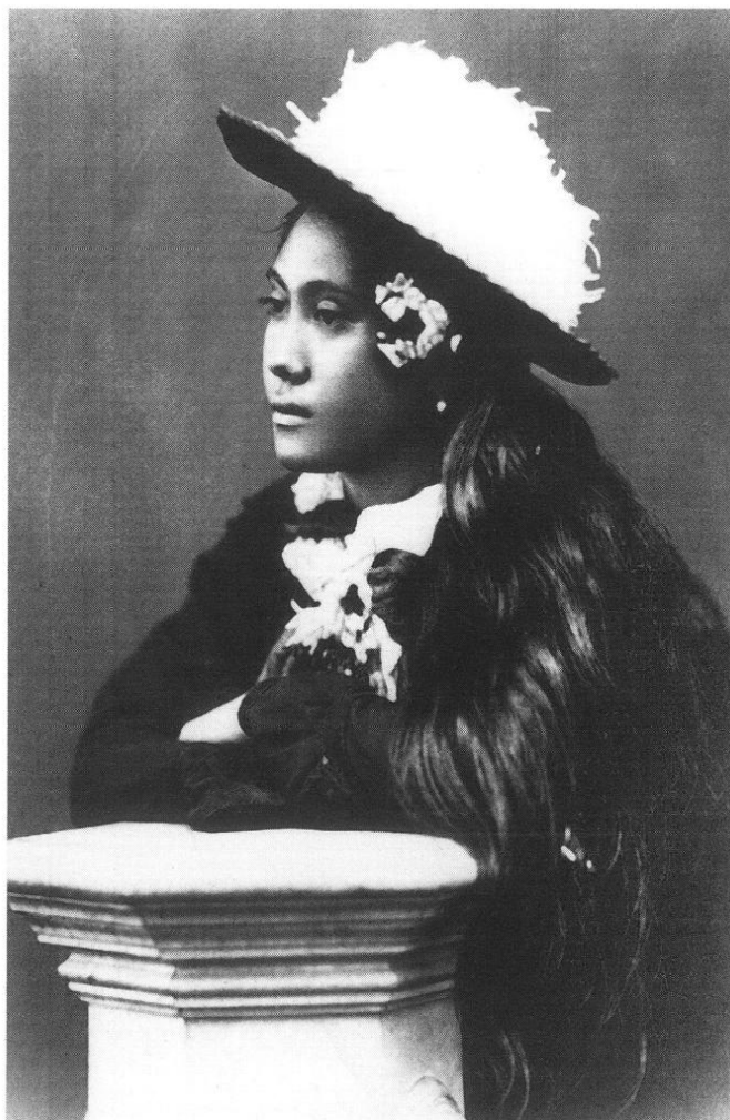
Tahiti. Femme indigène. Cl. Ropiteau (Ph. MH).