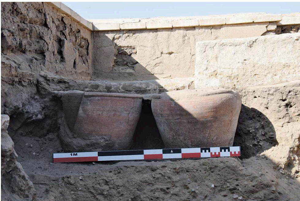
Fig. 6. Vases de stockage en céramique découverts en place dans le secteur sud de la fouille.