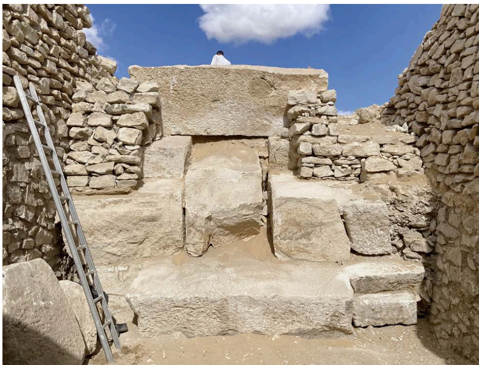
Fig. 7. Tranchée et blocs en place de la descenderie vu de l'entrée de la chambre funéraire.