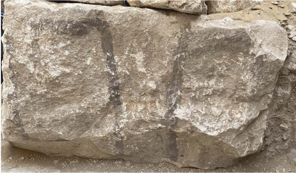
Fig. 8. Bloc en place contre le mur sud de la fosse comportant les marques mdꜣt nꜥr.