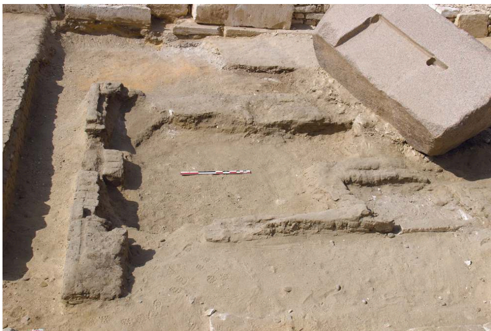
Fig. 2. Bâtiment de briques situé au nord du secteur en cours de fouille.