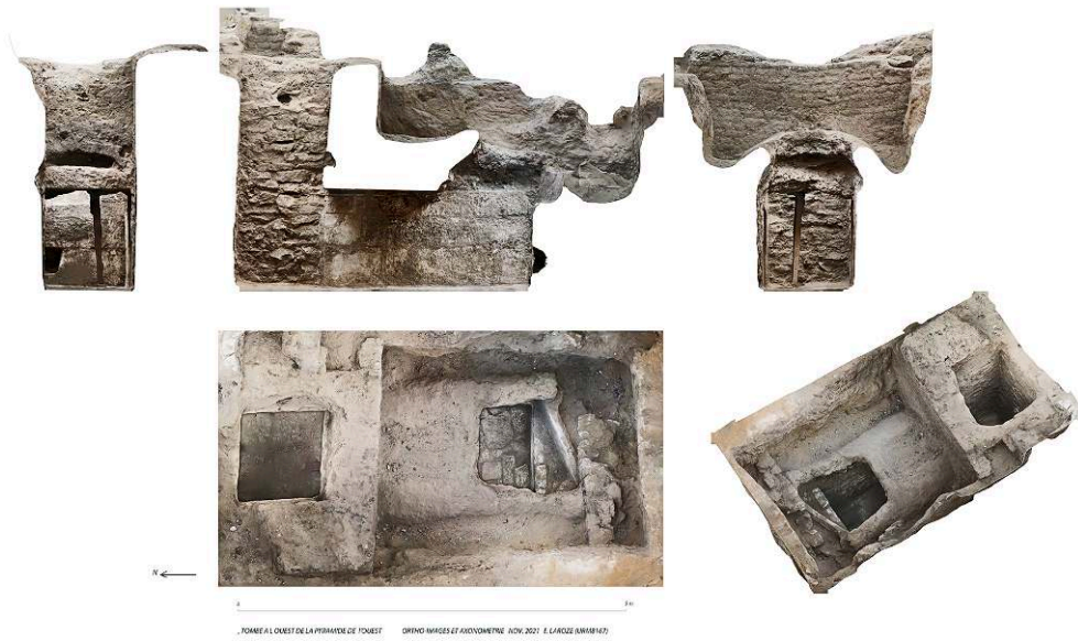
Fig. 3. Plan, coupe et élévation de la « tombe 2 » (E. Laroze/MafS).