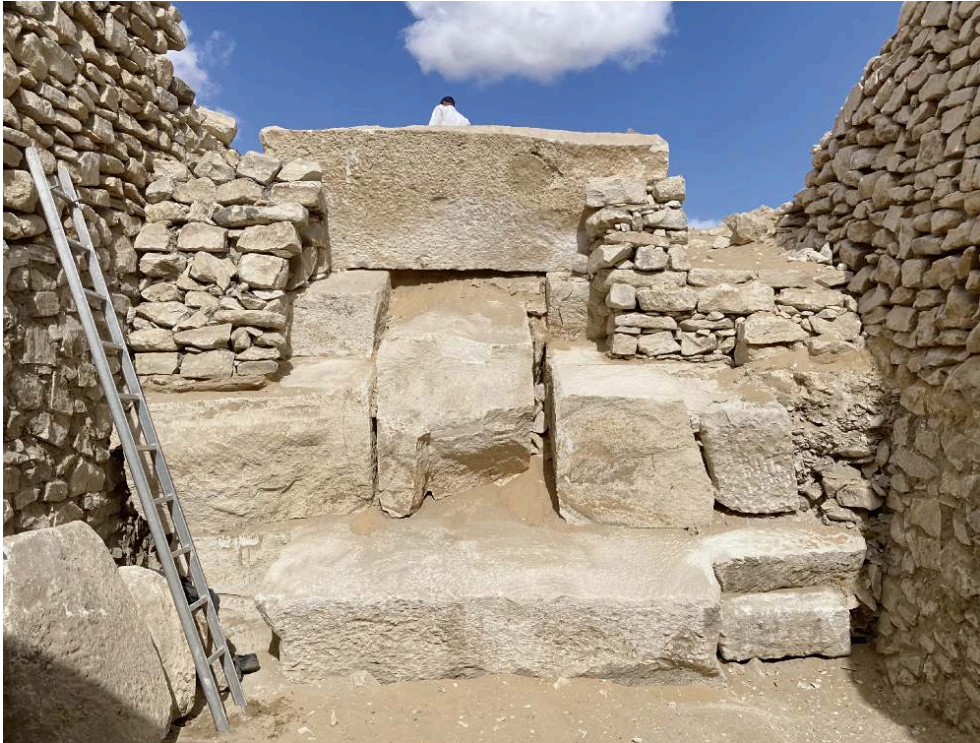
Fig. 7. Tranchée et blocs en place de la descenderie vu de l'entrée de la chambre funéraire.