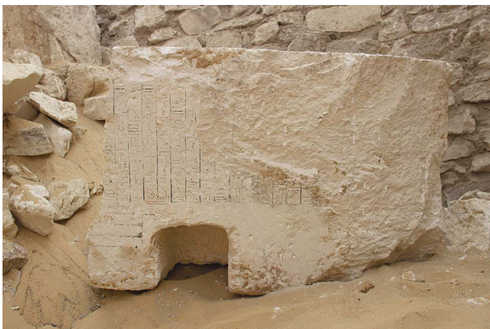
Fig. 9. Fragment de bloc inscrit de Textes des Pyramides trouvé sur sa face inscrite et redressé sur son lit d'attente.