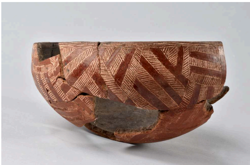
Fig. 4. Un des deux vases nubiens découverts dans la « tombe 2 » (Inv. 21-37).