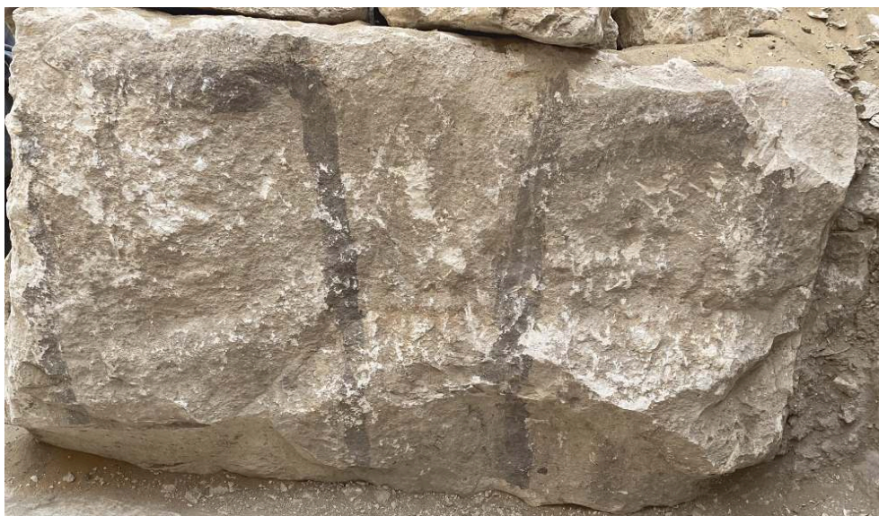
Fig. 8. Bloc en place contre le mur sud de la fosse comportant les marques md3t ntr.