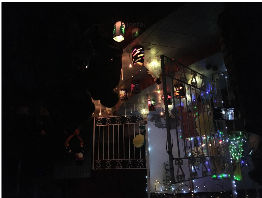
Registro de la autora.