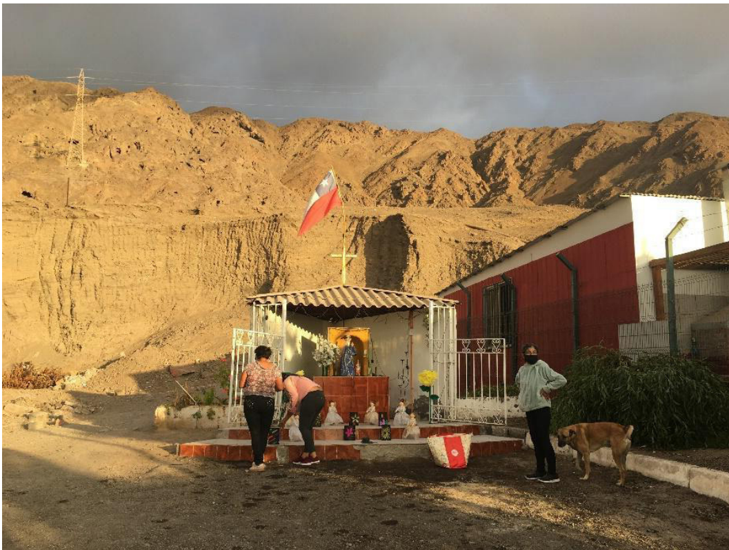
Foto 2. Gruta en la junta de vecinos Villa chica.

Al evento asistieron una treintena de vecinas y vecinos colombianos y chilenos del sector, los miembros de la junta de vecinos, la directiva del campamento, el cura de la población, dos integrantes de la colectividad ya mencionada y un concejal municipal. La celebración se desarrolló en un espacio baldío, justo al lado de la junta de vecinos, donde se construyó hace 5 años una gruta con La Virgen. El ritual tuvo una duración de 3 horas, contando el tiempo de preparativos antes del inicio. La preparación comenzó a las 18 horas, con la instalación de faroles, velas y adornos alrededor de la Virgen (ver Foto 2). En ese mismo momento se instalaban los equipos de sonido que servirían para conectar el micrófono y proyectar la música, principalmente Villancicos, que se escucharía durante la celebración.