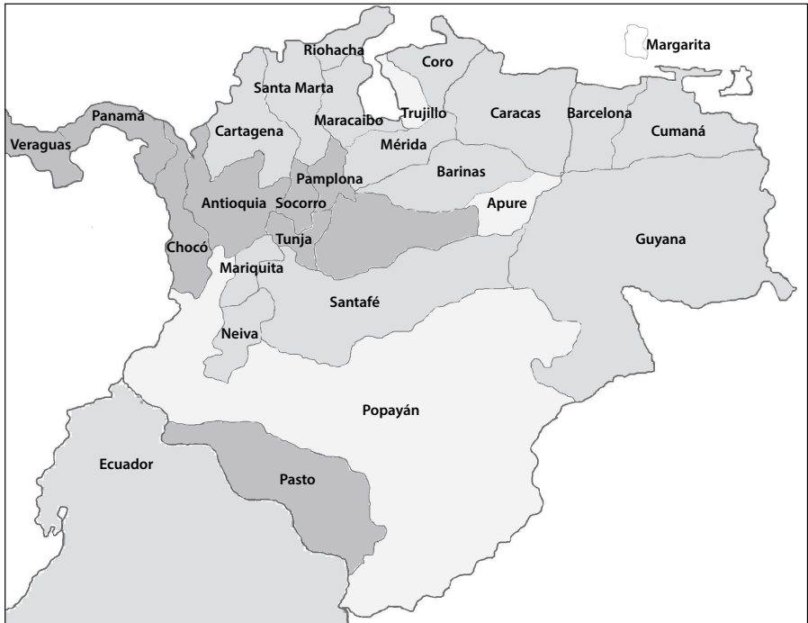
Mapa 3. Lugares en que fueron elegidos los santanderistas y los bolivarianos, 1827