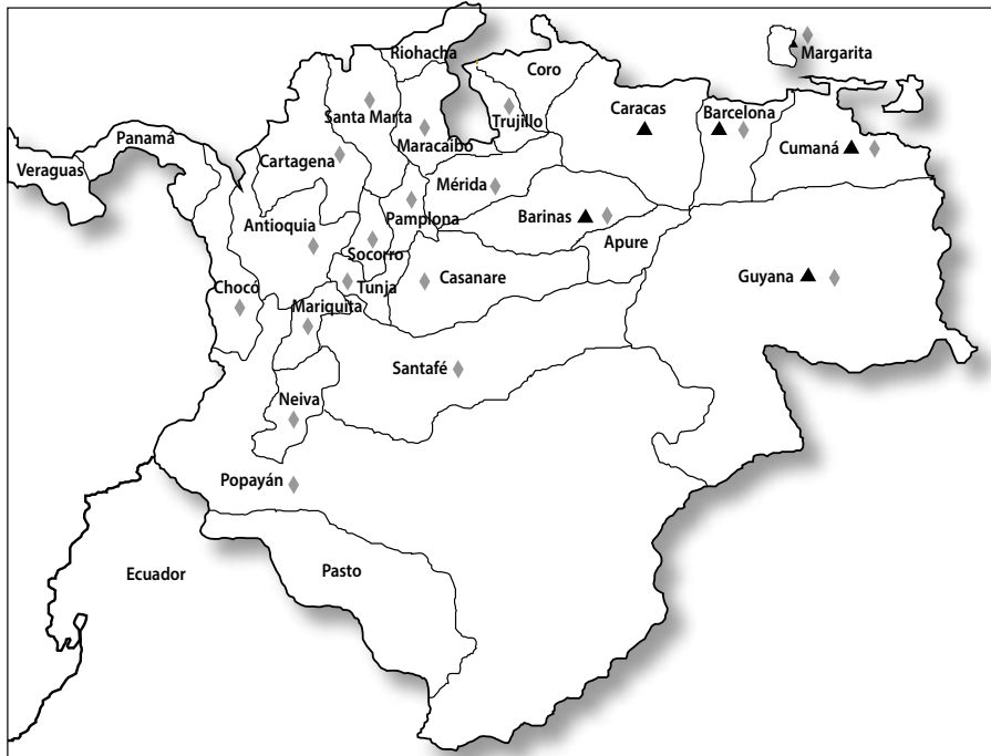
Mapa 1. Provincias que realizaron elecciones en 1818 y 1820

Fuente: Clément Thibaud, Républiques en armes. Les armées de Bolívar dans les guerres d'indépendance du Venezuela et de la Colombie (Rennes: Presses Universitaires de Rennes, 2015), 285 y ss.