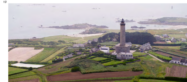
5.4.2.1.A. — Phare de l'île de Batz, au SW (2012).

07 Vue du Nord, l'île de Batz montre la tour du sémaphore (48° 44,78' N – 4° 00,69' W) et surtout le phare (48° 44,72' N – 4° 01,61' W), tour grise haute de 43 m, entourée de maisons. L'île est débordée de tous côtés par des dangers. Les plus au large sont : – à l'Est, la Basse Astan , couverte de 0,8 m d'eau, marquée par la bouée « Astan » (48° 44,91' N – 3° 57,66' W), cardinale Est lumineuse ; – au Nord, la Grande Basse (48° 45,92' N – 4° 01,64' W), couverte de 0,5 m d'eau ; – à l'Ouest, Men Aodi (48° 44,64' N – 4° 03,39' W), roche non balisée découvrant de 0,1 m.