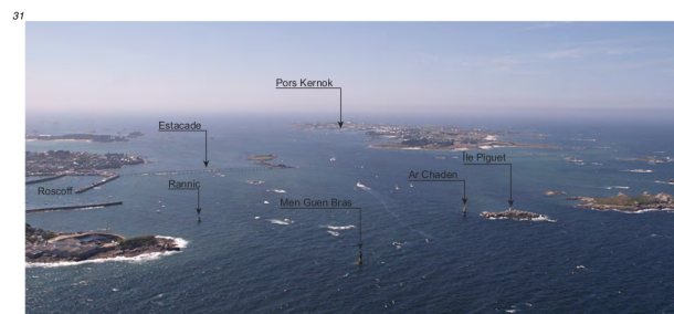
5.4.2.1.C. — Canal de l'Île de Batz, au NW (2012).

décrit, et chaque mouillage, accès de port et entrée de chenal est détaillé. Les consignes mentionnent également les spécificités de la météorologie, la courantologie et la réglementation locales. Des photographies montrant les amers et les ports notables sont intercalées dans le texte. Elles illustrent également le positionnement relatif des différentes entités géographiques et doivent conforter le lecteur dans la représentation qu'il se fait de son environnement. La figure 1 montre un extrait des Instructions nautiques . On y trouve des instructions pour accéder au chenal de l'Île de Batz. Ces instructions font référence à des entités spatiales nommées et non-nommées telles que des balises, un clocher, des feux, une île et des tourelles. Des aides virtuelles à la navigation telles que des alignements, une route et un secteur sont également citées. Dans cet extrait, il y a des instructions distinctes pour des navires de différentes tailles. Les instructions peuvent, en outre, dépendre des conditions météorologiques (p. ex. par vents d'est), océanographiques (p. ex. à marée basse) ou temporelles (p. ex. de nuit). Le texte est accompagné d'une photo montrant le chenal ainsi que certaines entités spatiales citées dans le texte.