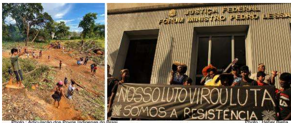
Figure 4. Mobilisations contre le projet foncier.

À gauche : occupation du terrain suite à la première coupe d'arbres, le 30 janvier 2020 ; à droite : mobilisation au tribunal de justice fédéral de São Paulo, le 4 mars 2020.