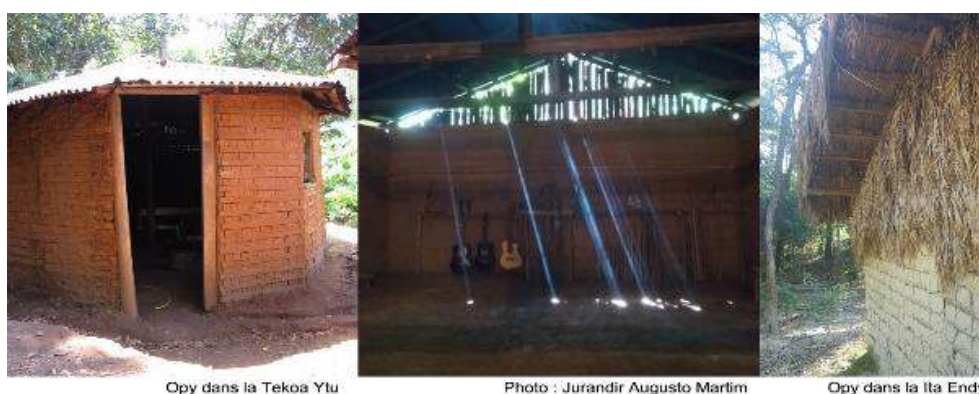
Figure 6. Opy de la terre indigène du pic du Jaraguá.

À gauche, entrée de l'opy : le mur pignon orienté à l'est est réalisé en torchis avec la partie supérieure en fibres ; au milieu, le mur pignon orienté à l'est au matin ; à droite, vue depuis l'extérieur du mur pignon de l'opy de la communauté Ita Endy.