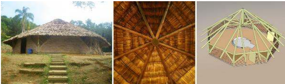
Figure 8. Opy de la terre indigène de M'Biguaçu.

Format octogonal dicté par les poutres de la toiture de la maison des prières.