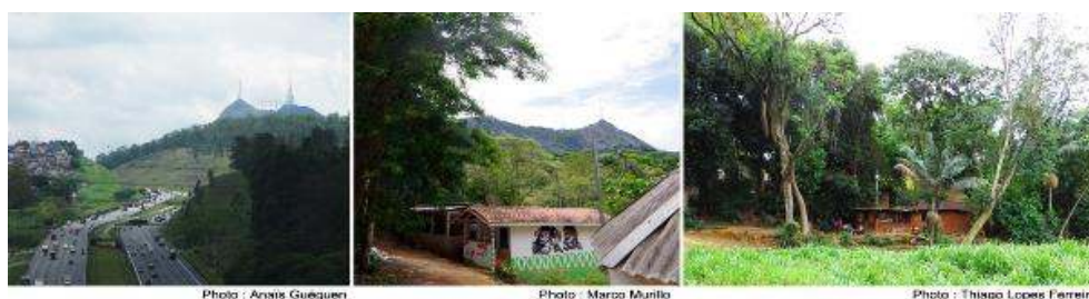
Pic du Jaraguá depuis l'autoroute et depuis Tekoá Ytu ; vue de Tekoá Ytu insérée dans la végétation.