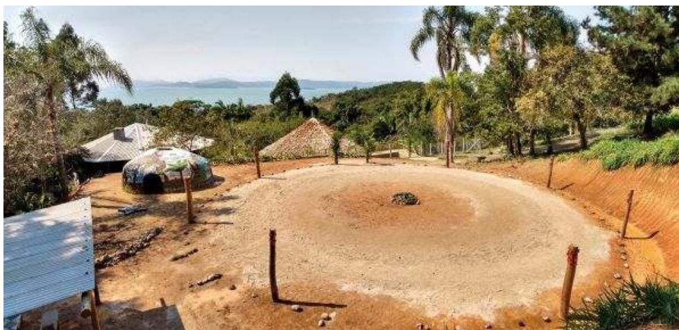
Figure 7. Vue sur la partie spirituelle de la communauté Yynn Moroithi Wherá.

Au premier plan, cercle de danse et espace de sudation ; en arrière-plan, toit de l'opy au centre et de la cuisine collective à gauche.