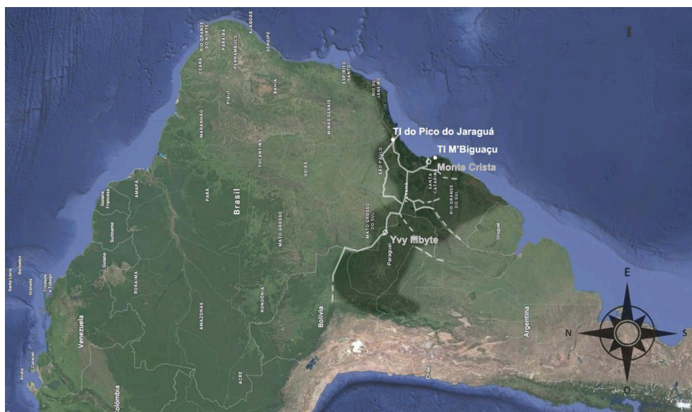
Figure . Yvyrupa , territoire traditionnel des Guarani 36

Localisation de lieux sacrés de la géographie culturelle guarani, du Peabiru et des terres indigènes étudiées.