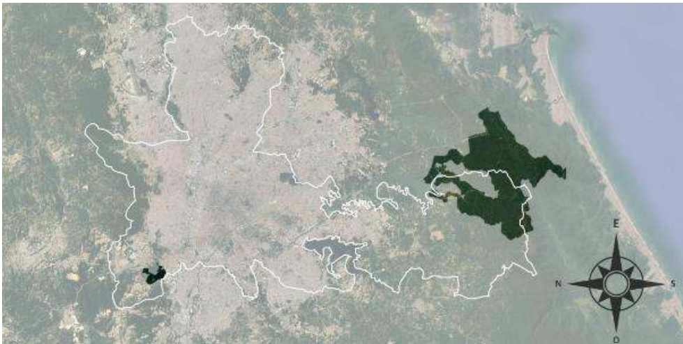
Figure 2. Localisation des terres indigènes guarani de la municipalité de São Paulo.

Terre indigène du Jaraguá au nord-ouest et celle de Tenondé Porã au sud de la métropole. Réalisation Anaïs Guéguen Perrin.