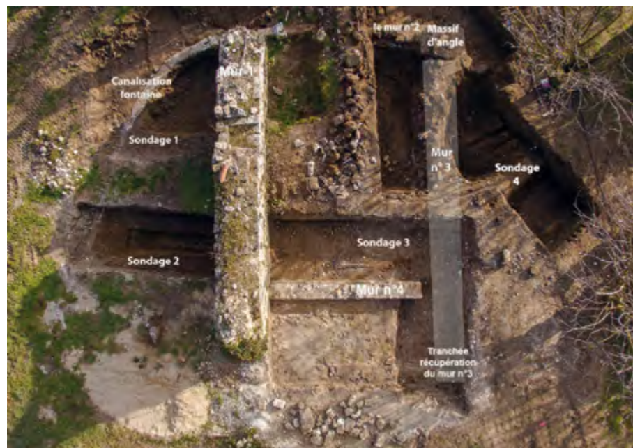
Fig. 164 – LACOSTE, Maison-Basse. Photographie par drone de l'ensemble des vestiges archéologiques (infographie P. De Michèle/SADV).