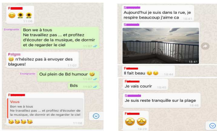
Figure 2 : Exemple d'échanges Whatsapp entre mars et mai 2020

En marge du cours planifié et formel présenté ci-dessus, différents dispositifs ont été mis en place pour renforcer les présences sociocognitives et socioaffectives. L'incertitude face au virus, l'éloignement de leur pays et de leurs proches et l'incompréhension des différentes mesures prises par l'état français du fait de leur maîtrise imparfaite de la langue rendaient le climat particulièrement anxieux pour ces apprenants. Un groupe WhatsApp (Figure 2) créé à cette occasion a permis à la fois de garder le contact, de diffuser des informations administratives et pédagogiques mais aussi de faire place à une certaine forme d'humour en partageant des vidéos et des dessins parodiques. Des apprenants d'ordinaire plus réservés ont bénéficié de ce mode de communication informel pour partager documents et informations personnelles.