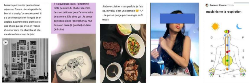
Figure 6 : Les 5 sens (extraits du Padlet)

Quant au Padlet (Figure 6), on y trouve des publications "sensorielles", redonnant vie aux 5 sens et donc au corps : recettes de cuisine (goûts), playlists et instruments de musique (ouïe), dessin d'art (vue), soin de la peau (toucher), odeur des jardins (odorat). Des séances de sports ou de yoga montrent aussi à quel point il était important de prendre soin de son corps.