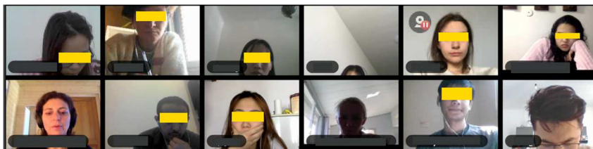
Figure 4 : Le corps des apprenants à l'écran

(Guichon & Tellier, 2017) qui jouent pourtant un rôle essentiel dans la dynamique de groupe (Tellier, 2020). En ce qui concerne les apprenants, en mode synchrone, on constate une difficulté à cadrer leur visage, moduler leur voix et focaliser leur regard (figure 4). Certains n'avaient pas de caméra, d'autres ont préféré rester invisibles et communiquer par écrit. Cette relation dégradée à son corps d'apprenant fait que certaines sensations et émotions sont filtrées et plus difficiles à transmettre au groupe.