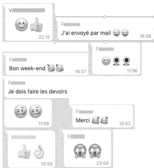
Figure 5 : Quelques smileys (extraits de whatsapp)

Cependant, les outils utilisés en asynchrone ont permis de compenser l'absence des corps. Ainsi, la variété des smileys (figure 5) présents dans tous les dispositifs permet de livrer des réactions personnelles et peut-être parfois de manière plus spontanée qu'en présentiel.