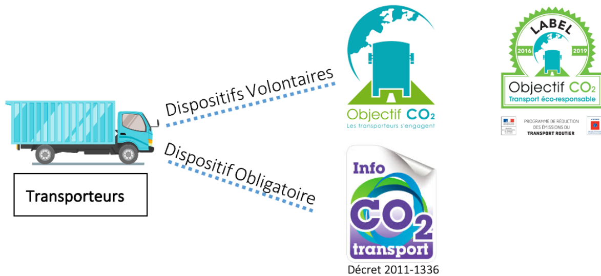
Schéma 1 : Présentation des dispositifs français à l'égard des transporteurs