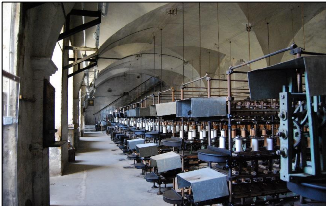
Figure 6. L'intérieur du Moulinage de La Neuve