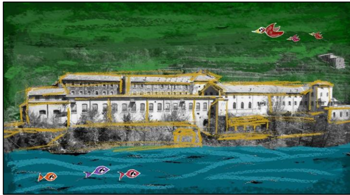
Figure 8. L'image du flyer de présentation du collectif de Chirols

installe, porté par une association, dans des locaux publics situés dans la partie la plus ancienne du site. Il y a quelques années, des privés frappés par le potentiel du lieu se rencontrent et décident de créer un collectif pour racheter et reconverter la partie restée privée. Le Collectif de Chirols (figure 8) se réunit chaque mois depuis trois ans et construit son projet dans une gouvernance horizontale et fondée sur le consentement. Il se compose d'une association collégiale comptant vingt-huit membres actifs et trois-cent-quinze sympathisants, et d'une coopérative SAS. Le projet se compose d'un pôle culturel, d'un espace de coworking , d'une cantine, d'hébergements, d'un centre de formation, d'habitats et d'entreprises. L'achat s'est concrétisé pendant l'hiver 2018-2019 et les premiers chantiers participatifs commencent. Le Collectif porte également des projets artistiques en lien avec l'histoire du lieu et la mémoire.