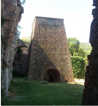
Figure 2. Un des hauts-fourneaux de La-Voulte-sur-Rhône, structure out-door