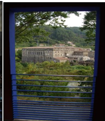
Figure 7. Le Moulinon depuis « Vous me direz »