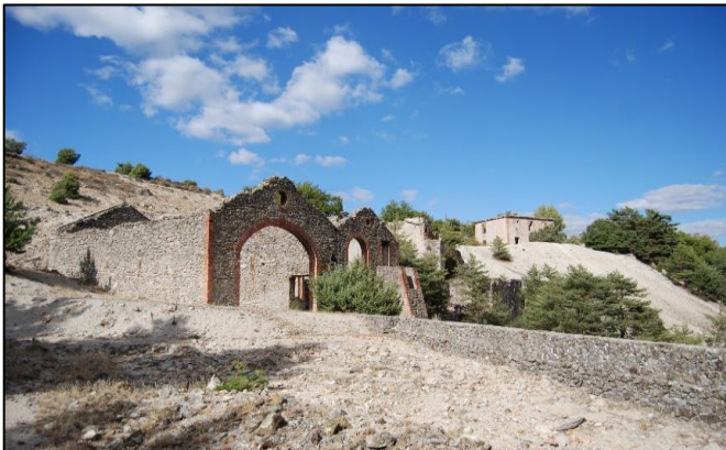
Figure 4. Le site abandonné de Saint-Cierge-la-Serre