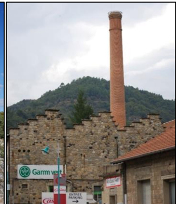
Figure 5. Le magasin Gamm Vert dans l'ancienne usine à tanin de Saint-Sauveur-de-Montagut