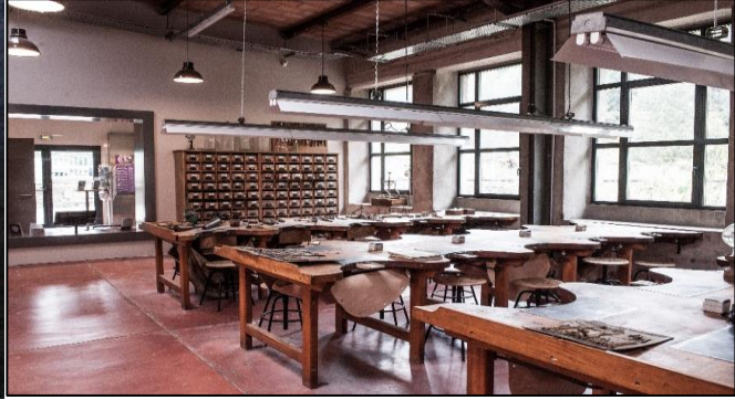
Figure 3. Intérieur de l'Atelier du bijou