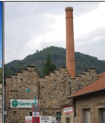
Figure 5. Le magasin Gamm Vert dans l'ancienne usine à tanin de Saint-Sauveur-de-Montagut