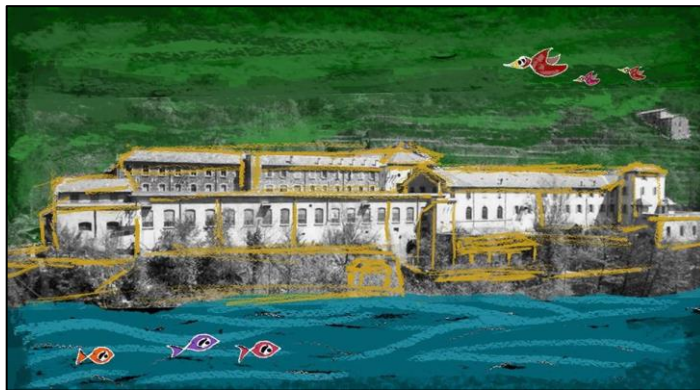
Figure 8. L'image du flyer de présentation du collectif de Chirols

installe, porté par une association, dans des locaux publics situés dans la partie la plus ancienne du site. Il y a quelques années, des privés frappés par le potentiel du lieu se rencontrent et décident de créer un collectif pour racheter et reconverter la partie restée privée. Le Collectif de Chirols (figure 8) se réunit chaque mois depuis trois ans et construit son projet dans une gouvernance horizontale et fondée sur le consentement. Il se compose d'une association collégiale comptant vingt-huit membres actifs et trois-cent-quinze sympathisants, et d'une coopérative SAS. Le projet se compose d'un pôle culturel, d'un espace de coworking , d'une cantine, d'hébergements, d'un centre de formation, d'habitats et d'entreprises. L'achat s'est concrétisé pendant l'hiver 2018-2019 et les premiers chantiers participatifs commencent. Le Collectif porte également des projets artistiques en lien avec l'histoire du lieu et la mémoire.