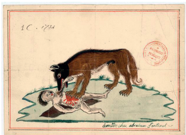
Figure 3 : Dessin rehaussé de couleurs « À Mende chez Abraham Fontanel »

pelage, rappelant le noir de la tête et de l'échine 10 . La troublante violence de cette image, suscitée par la nudité de cette enfant à peine pubère et par la posture du loup sur son corps offert à la dévoration, s'offre en écho d'une lecture sexuelle de l'agression d'Agnès Mourgues (figure 3).