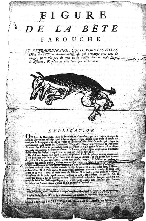
Figure 6 : Figure de la Bête farouche Occasionnel de F.-G. Deschamps, Paris, 1764