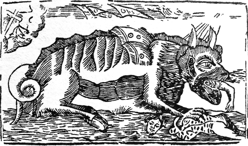
Figure 4 : Bois gravé. Clermont-Ferrand. XVIII e siècle Fonds privé