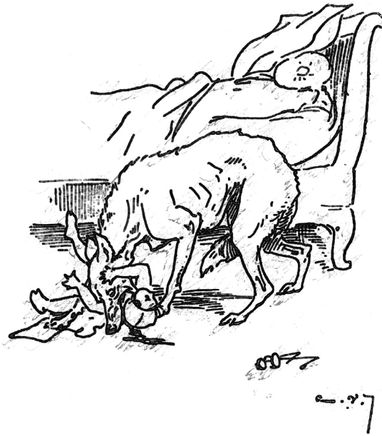
Figure 7 : Les Contes de Perrault Henri Laurens Éditeur, Paris, 1900 : Le Petit Chaperon rouge , illustrations d'Auguste Vimar Fonds privé