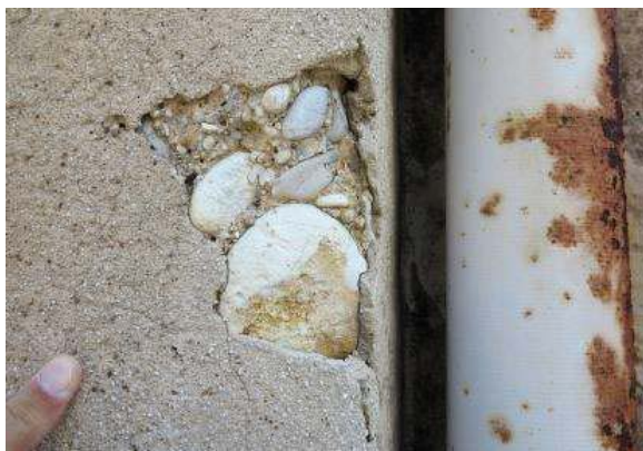
Fig. 04 : Moellon équarri de poudingue affleurant localement sous l'enduit ciment

Ce poudingue est un dépôt sédimentaire continental d'âge oligocène qui constitue le substratum de la ville [BRGM 1977]. Il affleure à quelques dizaines de mètres de là. Le matériau a été extrait en quantité au 19 e s., lors des grands travaux d'aménagement urbains (creusement de la rue impériale en 1864) et a été largement utilisé pour construire de grands murs de soutènement (voies ferrées, substructures de la nouvelle cathédrale). La maçonnerie du bâtiment est donc composée d'un matériau local de faible qualité, de finition frustre, de mise en œuvre rapide. Seuls quelques encadrements de baie ont été réalisés avec des blocs de calcaire marbrier urgonien (Pierre de Cassis) à patine blanche, taillés et enduits.