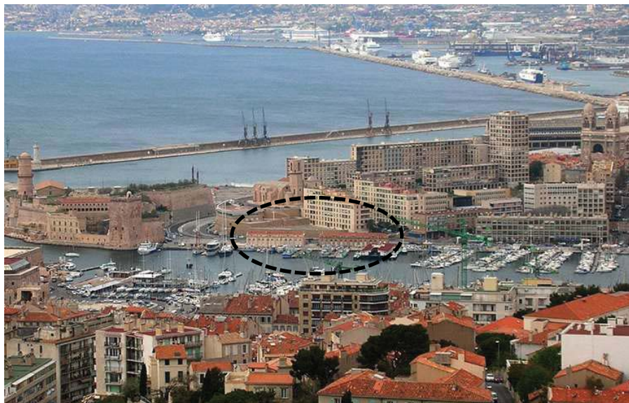
Fig. 01 : Localisation du pavillon de l'intendance sanitaire et du bâtiment des douanes sur le quai nord à l'entrée du Vieux-Port de Marseille

Le bâtiment des douanes est fermé et à l'abandon depuis plusieurs années. Il va prochainement bénéficier d'un programme de restauration. Une étude préliminaire a été menée en 2016 pour déterminer son mode de construction, la nature des matériaux et leur dégradation et pour définir un protocole de restauration adapté [BOUICHOU et al. 2016]. Un échafaudage provisoire a été dressé sur une travée sud de l'édifice pour permettre les observations détaillées et des prélèvements.