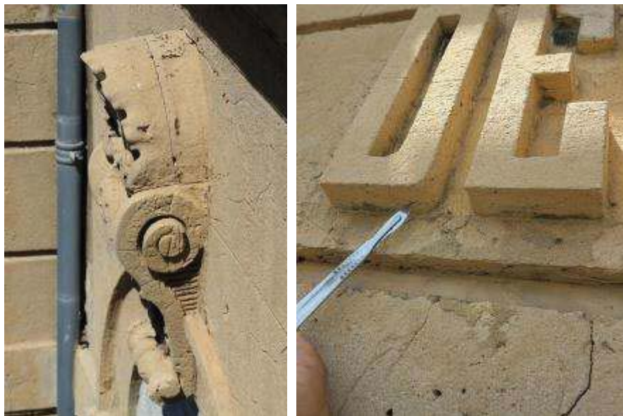
Fig. 05 : Mascaron assemblé en plusieurs éléments moulés préfabriqués (à gauche) et vestiges de peinture verte sous les lettres en mortier (à droite)

société Désiré Michel) sur le bâtiment des douanes [BOUICHOU et al. 2015]. En effet, le catalogue de cette société, publié en 1863, présentait la façade principale comme l'une de ses réalisations exemplaires.