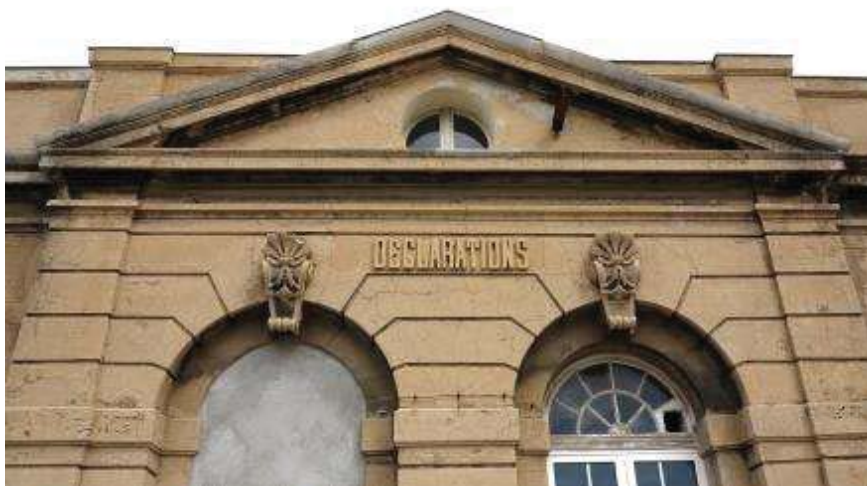
Fig. 03 : Vue de l'avant-corps central du bâtiment des douanes enduit et orné d'un décor architectural réalisé au mortier (y compris les lettres inscrites sur le fronton)

Le bâtiment des douanes est constitué d'une maçonnerie de moellons recouverte d'un enduit ocre qui dessine tout l'appareillage en faux joints et reproduit l'ensemble du décor architectural (fig.03).