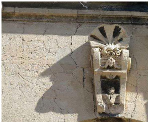
Fig. 08 : Faiëncage, érosion de l'enduit et formation de croûtes noires sur la façade sud

particulièrement exposées (corniches...). Par endroit, la surface brune et lisse de l'enduit est encore conservée. Enfin, un réseau dense de fissures de retrait (faiëncage) affecte la façade sud (fig.08) alors que ces fissures sont rares sur la façade nord. Le séchage plus rapide de la face ensoleillée a manifestement intensifié ce défaut inhérent aux enduits au ciment naturel. Les fissures se sont creusées et élargies au fur et à mesure de l'érosion et de la lixiviation. Elles traversent l'enduit jusqu'au substrat et causent des pertes d'adhérence étendues que l'on constate en sonnant l'enduit. Cependant, les lacunes sont rares et d'extension limitée. Aucune pathologie particulière associée à des sels n'a été observée à part des efflorescences localisées sur les parties hautes soumises à des infiltrations d'eau. Les teneurs en sels solubles sont faibles (sulfates 1-3.4%, chlorures 0.2-0.5%). Seul le gypse a été identifié par DRX.