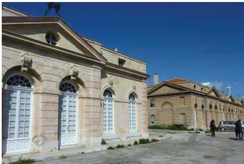
Fig. 02 : Vue des façades sud du pavillon de l'intendance sanitaire (1719) au premier plan et de sa réplique, le bâtiment des douanes (1862) à l'arrière-plan

Le matériau a été transporté par mer puis par chemin de fer à partir du 19 em s. L'intendance sanitaire a fait l'objet d'une restauration dans les années 90. Des pierres ont été changées et les façades nettoyées. L'administration portuaire occupe aujourd'hui les locaux.