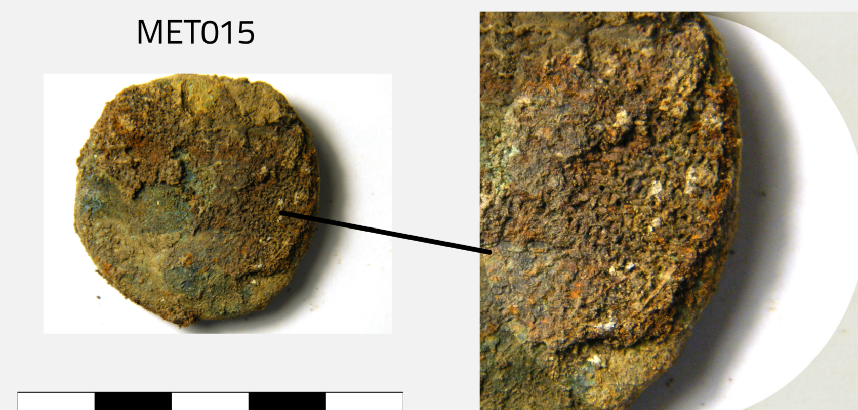
Fig. 5 : Tissu très fin prélevé sur la monnaie issue de la sépulture 219