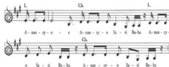
Fig. 4 : Extrait du chant « Anancy O, Sari Baba », chant traditionnel et rituel originaire de Carriacou enregistré par l'ethnomusicologue Alan Lomax. Le rapprochement avec le rythme du carnaval antillais s'impose. Le schéma rythmique du refrain entre en écho avec celui des premières mesures de « Wep », chanson de Jacob Desvarieux figurant en troisième position dans l'album Majestik Zouk de Kassav'.

Le call and response (chant participatif), avec reprise du refrain au ton supérieur, le recours à une base rythmique syncopée en huit temps, l'usage d'un tambour majeur pour donner le contrepoint aux choristes, sont autant d'éléments que l'on retrouve dans les deux musiques. Pour l'exemplarité, un extrait de la partition correspondant aux paroles a été reproduit ci-après.