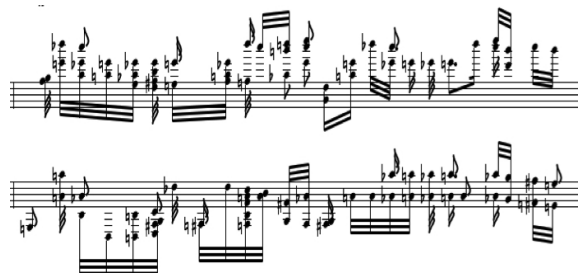
Fig. 5 : Extrait de partition correspondant à la première période du morceau Anancy O, Sari Baba , obtenu après conversion de fichier audio en partition musicale.

Le cas de Carriacou, une petite île voisine de la Grenade occupée par la France de 1667 à 1784, puis cédée aux Anglais après 117 ans de colonisation française, illustre la survivance de l'africanité qui a perduré pendant l'occupation anglaise. Les habitants de Carriacou et de sa voisine, Petite Martinique, constituent un isolat ethnoculturel vivant en quasi-autarcie depuis leur indépendance obtenue en 1972. Le créole à base lexicale africaine et française y a survécu. L'esprit créole y est toujours présent et, de fait, le Big Drum et le Gran Bèlè kat kou [43] partagent une structure polyrythmique basée sur une base métrique de type 3/4 alternant parfois avec une base 6/8. Cette idiosyncrasie distingue les musiques afrocaribéennes des factures rythmiques occidentales classiques, comme le précise Claude Césaire : « [c]'est la période de la polyrythmie qui servira de valeur et non la mesure au sens occidental [44] . »