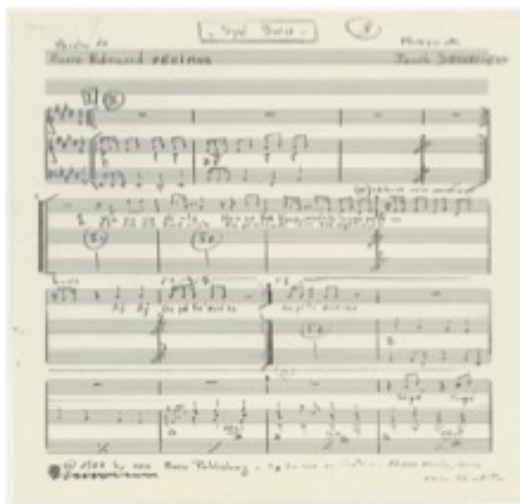
Fig. 2 : Partition de Syé Bwa , composée par Pierre-Édouard Décimus en 1988 © CBS Music Publishing.

Toutes proportions gardées, ces migrations interinsulaires ont permis d'équilibrer qualitativement l'émigration massive d'Antillo-guyanais vers la France hexagonale. Dans un sens, elles ont également favorisé la diversification des productions médiatiques et culturelles plus tournées vers l'outre-mer française, comme les programmes télévisés conçus et animés par Claudy Siar, certains films comme Siméon , ou les radios installées en banlieue parisienne.