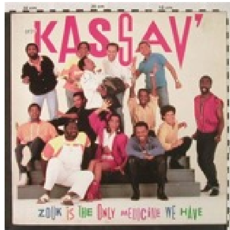
Fig. 1 : Couverture de l'album Zouk Is The Only Medicine We Have , produit en 1988 au Royaume-Uni sous le label Greensleeves. Source : www.lcpe.de

Fig. 3 : Couverture de l'album Zouk Is The Only Medicine We Have , produit en 1988 au Royaume-Uni sous le label Greensleeves. Source : www.lcpe.de