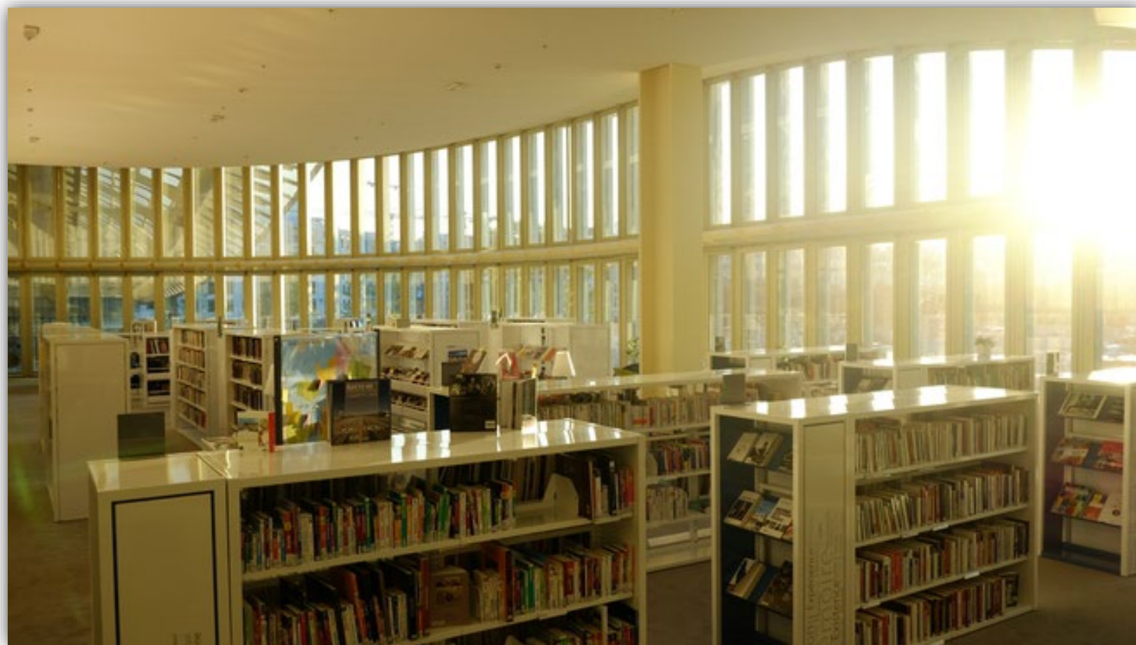
Médiathèque de la Canopée la fontaine (Paris, Les Halles)