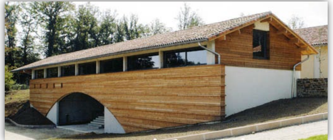
Médiathèque du Père Castor (Meuzac, candidature 2022)