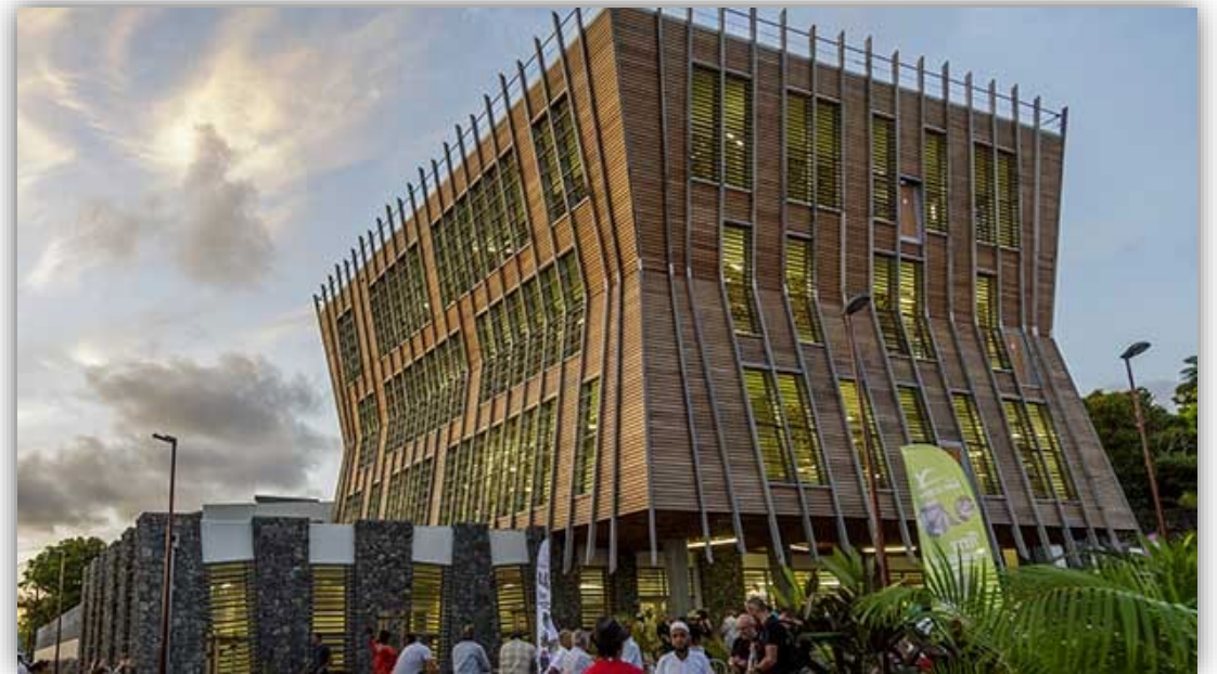
Médiathèque de Saint-Joseph (La Réunion, candidature 2019)