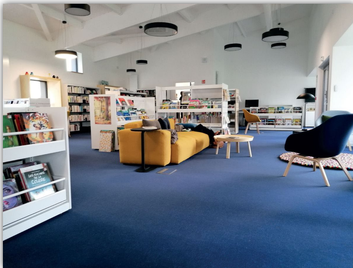
Médiathèque Mouezh ar Galon (Tourc'h, Finistère)