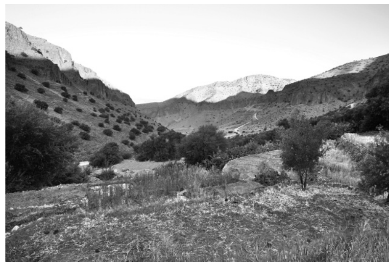
Fig. 2 – Irrigation d'une parcelle d'orge depuis la source 2 dans l'ancien périmètre de la source 1, durant le tour d'eau du matin. La différence de croissance de l'orge dans les parcelles qui appartiennent à différents propriétaires, et dont la plupart sont déjà moissonnées, témoigne de la disparité des apports en eau (cliché : V. Héritier-Salama).

Sous la forme de droits héréditaires, l'eau de ces sources est partagée théoriquement entre tous les habitants, qui prennent collectivement en charge l'entretien des différents ouvrages (voire leur installation). Dans les faits, seuls les hommes, cependant, héritent effectivement des droits d'eau et prennent part à sa gestion. Les femmes sont écartées de l'héritage foncier et hydrique (elles reçoivent plutôt une compensation sous forme de dot), et ne vont que très rarement irriguer les champs. Directement, lors de l'assemblée des hommes du village (la jma'a ) ou par le biais d'un représentant de son lignage, chaque ayant droit participe à ces travaux et aux décisions qui les accompagnent – une condition sine qua non pour qu'elles soient acceptées par tous et que chaque détail ne constitue pas un objet potentiel de discussion.