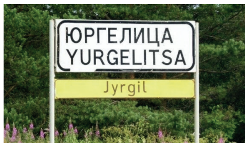
Signalisation multilingue à l'approche du village russe de Yurgelitsa, Jyrgil, en dialecte carélien d'Olonets.