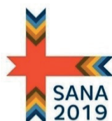
Logo du programme de financement SANA 2019.

Enfin, il est également à noter l'existence d'un représentant des peuples fenniques, en l'occurrence un Ingrien, Dmitri Harakka-Zaitsev, en charge plus largement de la représentation des peuples autochtones européens, russes et caucasiens auprès du forum de l'ONU sur les peuples autochtones (UNPFII).