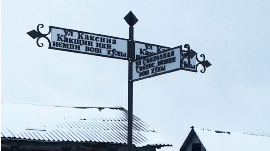
La signalétique bilingue de Kazym grâce à la volonté des habitants.