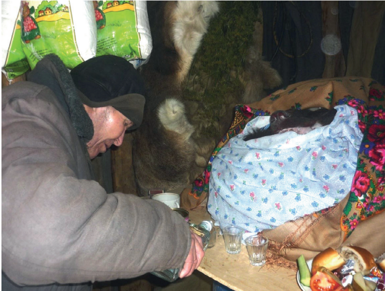
Offrande rituelle lors des jeux de l'Ours ( Пўну як ).