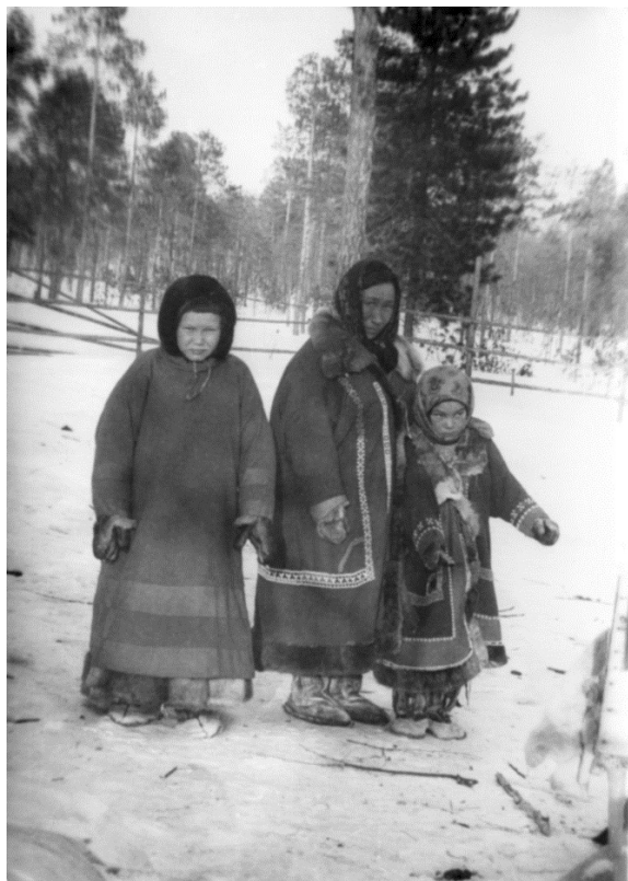
Famille khanty du Tromagan au moment du boom pétrolier au début des années 1980.