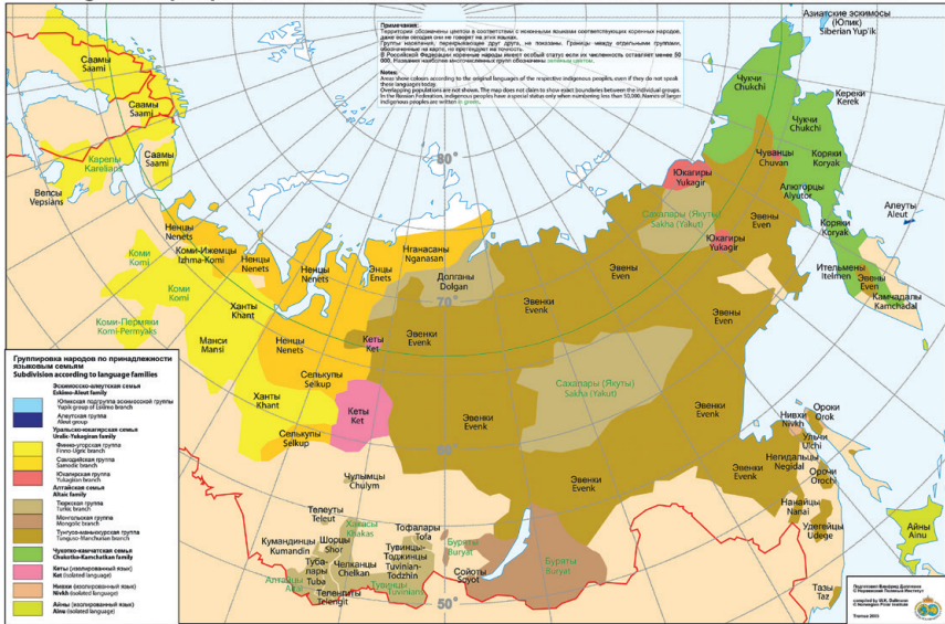
Carte des peuples autochtones du Nord, de la Sibérie et de l'Extrême-Orient.

Avec l'aimable autorisation de W. K. Dallmann, Institut Polaire Norvégien, 2005.