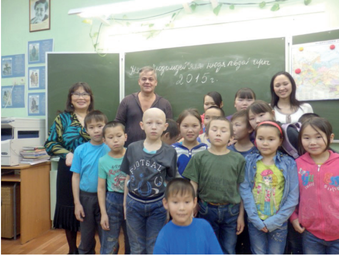
La classe des enfants de la toundra, Doudinka, 2015.