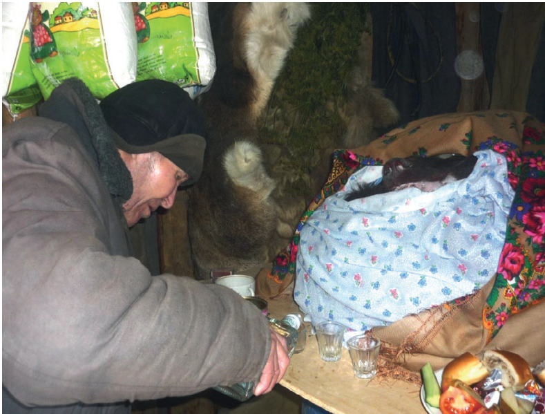
Offrande rituelle lors des jeux de l'Ours ( Пўну як ).