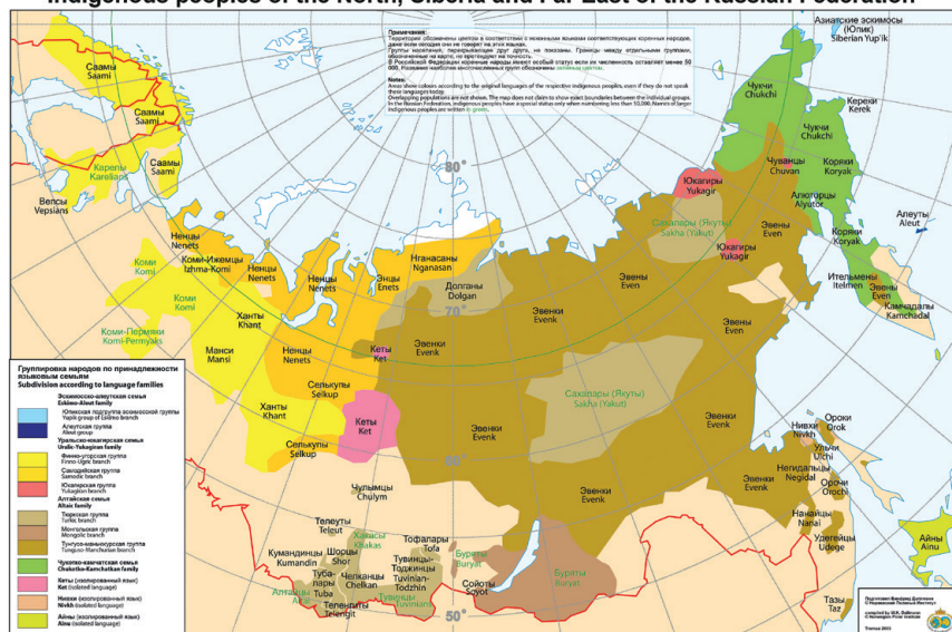
Carte des peuples autochtones du Nord, de la Sibérie et de l'Extrême-Orient. Avec l'aimable autorisation de W. K. Dallmann, Institut Polaire Norvégien, 2005.

Pour tenter de contribuer à un cadre de réflexion, il conviendra de dépasser le discours officiel qui prévaut dans la société russe pour mettre en lumière la mémoire et la parole occultées des communautés elles-mêmes, à travers l'exemple de trois groupes de langues ouraliennes (rameau finno-ougrien et rameau samoyède), mais aux écosystèmes distincts : les Khantys (anc. Ostiak, 30 943) et les Mansis (anc. Vogouls, 12 269), traditionnellement semi-nomades, chassent et pêchent le long des rives de l'Ob dans les taïgas subarctiques du district autonome des Khanty-Mansi-Iougra (XMAO en russe), tandis que les Nénètes (anc. Samoyèdes, 44 640), éleveurs de rennes, nomadisent dans les toundras arctiques du district autonome Iamalo-Nénète (IANA O). Fondé essentiellement sur mes travaux de terrain, entretiens et extraits de récits de vie collectés par mes soins, de 2013 à 2019, des deux côtés du cercle polaire, cet article veut rendre compte, dans une perspective historique et anthropologique, non seulement d'un état des lieux, mais de l'expérience non écrite de locuteurs khantys, nénétes et mansis qui évoluent parfois encore dans leurs langues nées de leur « alliance avec l'univers », mais le plus souvent dans l'expression de relations dissymétriques : le russe. Car la