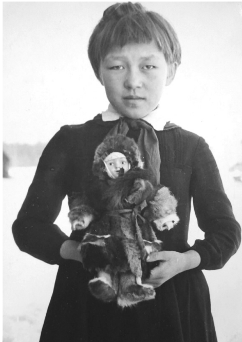
V. I., élève khanty, avec la poupée « russe » habillée par sa grand-mère