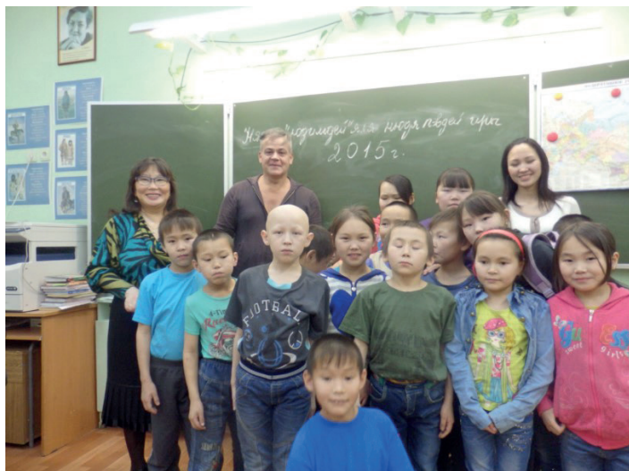
La classe des enfants de la toundra, Doudinka, 2015.