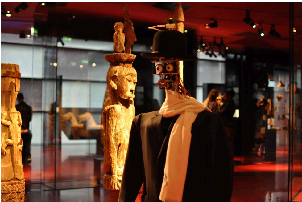
3 : LE ROBOT BERENSON, MUSÉE DU QUAI BRANLY, 2015.