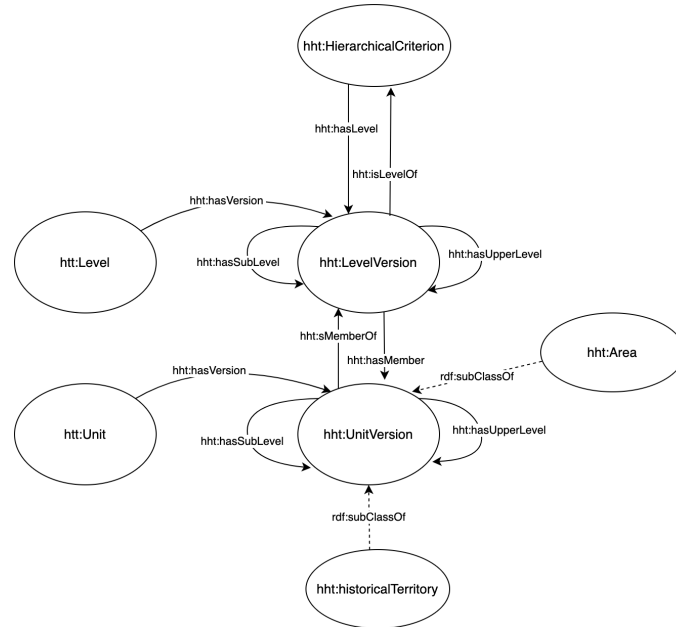
FIG. 1 – Schéma de l'ontologie HHT

Chacun de ces concepts permet de décrire l'espace. Pour prendre en compte, leur évolution dans le temps nous définissons 3 nouveaux concepts, versions des concepts précédents, possédant chacun leur propre période de validité (à travers la propriété hht:validityPeriod ).