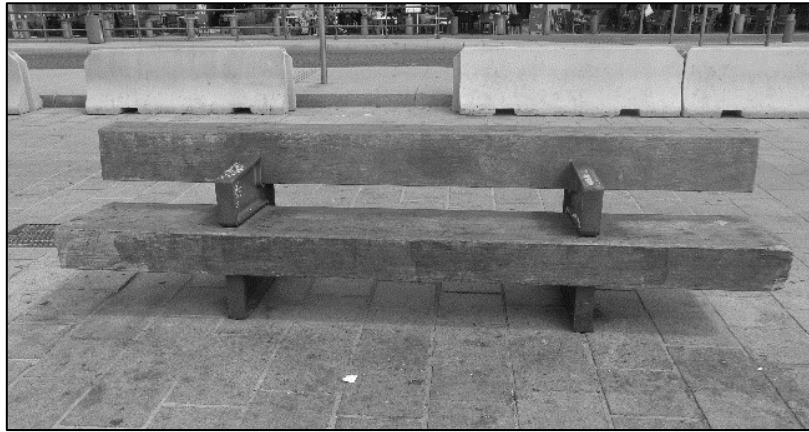
Photographie 1 : L'implantation d'un mobilier urbain ségrégatif et excluant sur le quai du port.

en trois pour éviter que l'on ne s'y allonge (Photographie 1). Ces dispositifs sont exacerbés par l'omniprésence des caméras de surveillance 25 qui tendent à aseptiser l'hypercentre tout en autorisant une certaine criminalisation de la pauvreté.