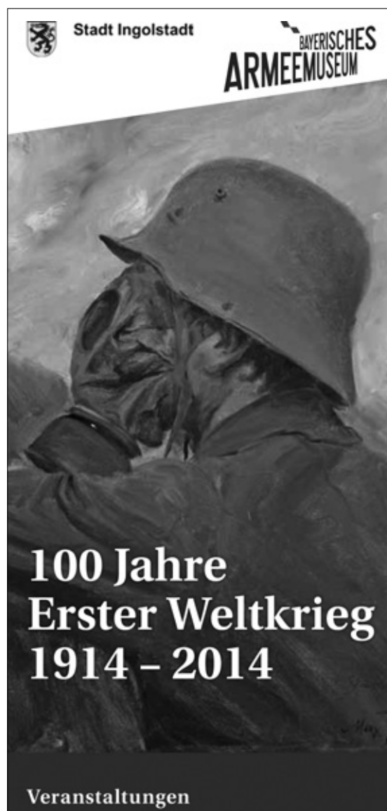
100 Jahre Erster Weltkrieg, Bayerisches Armeemuseum, Stadt Ingolstadt, 2014.