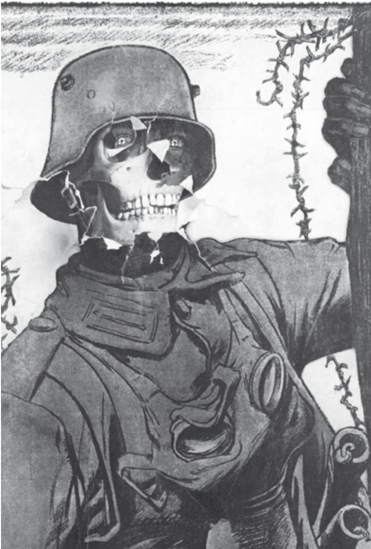
Ein Krieg wird ausgestellt, Die Weltkriegssammlung des Historischen Museums (1914-1918), Historisches Museum, Frankfurt-am-Main, 1976.

Première Guerre est pour des raisons idéologiques, principalement présentée à l'école comme un prélude à la Révolution d'octobre de 1917.