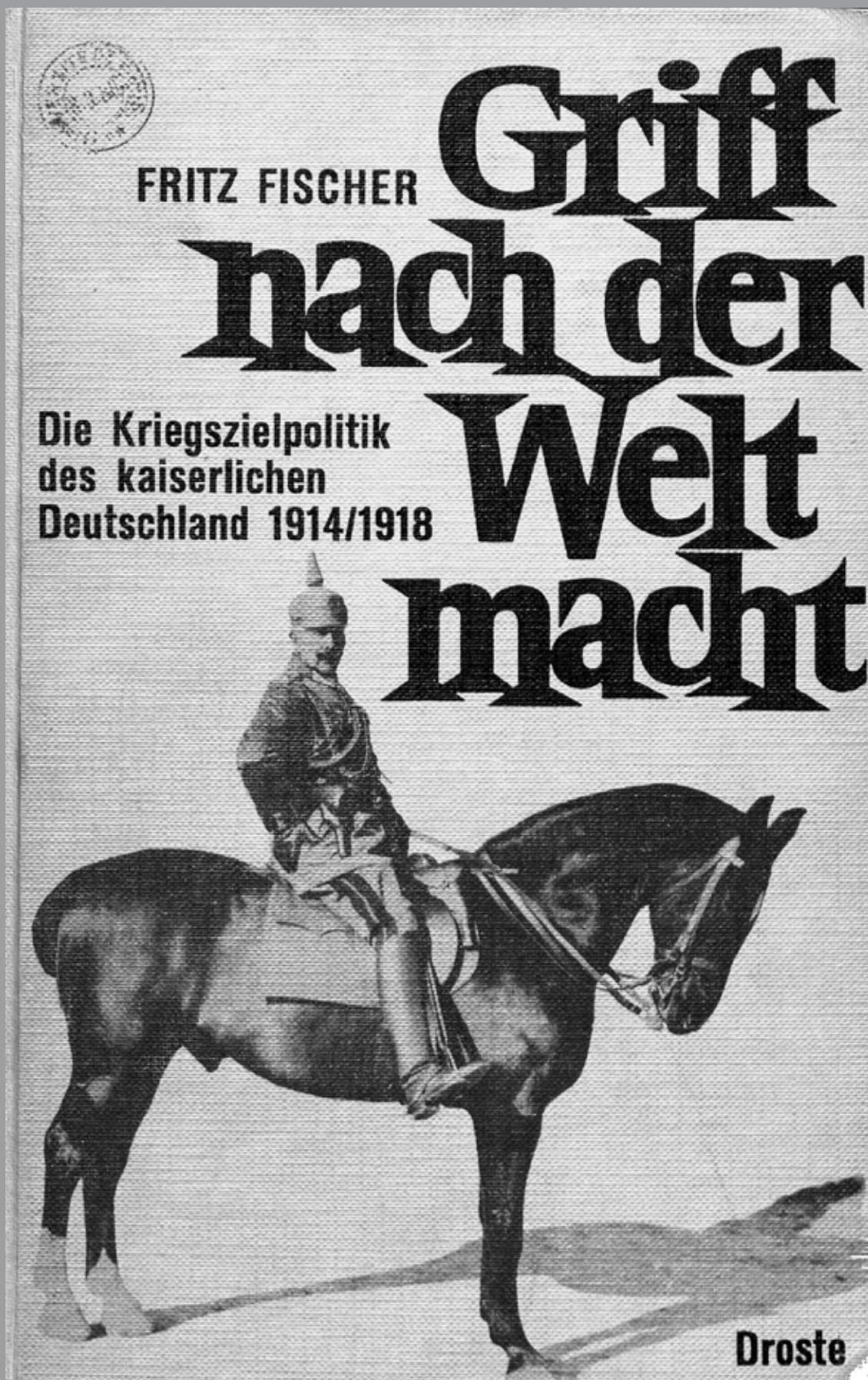
Fritz Fischer, Griff nach der Weltmacht, Die Kriegszielpolitik des kaiserlichen Deutschland 1914/1918, Droste, 1961