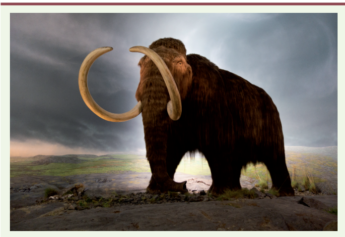
Figure 1. © Thomas Quine. Mastodon. Royal Victoria Museum, Victoria, British Columbia, Canada, sous licence CC BY 2.0.

les rétrovirus endogènes, éliminant trois xénoantigènes et introduisant neuf gènes humains qui améliorent la compatibilité des organes de l'animal avec l'organisme humain [6] 3 . La similitude entre ce travail et ce qui est prévu pour le mammoth est évidente, mais, comme nous le verrons, la tâche est bien plus ardue dans ce dernier cas.