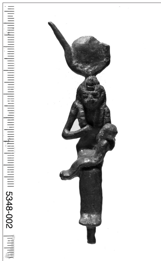
FIG. 24. Karnak: statuette d'Isis lactans provenant de la chapelle d'Osiris Neb-neheh.

Par ailleurs, l'état de dégradation avancé de la chapelle éthiopienne d'Osiris Neb-ânkh, au nord de notre secteur, nous a amenés à demander l'intervention d'urgence d'une équipe du CFEETK pour le démontage et le remontage de la façade. Après un dégagement du petit parvis dallé de l'édifice par nos soins, N. Pelletant (tailleur de pierre), R. Mensan (archéologue), F. Dubois et A. Oboussier (restaurateurs) ont assuré le suivi du chantier. Les travaux ont permis la découverte d'un lot important de remplois, dont le plus notable est un fragment de linteau de Néchao II aimé d'Osiris Neb-ânkh, postérieur à la décoration de l'édifice sous Taharqa. Cette découverte confirme le fait que cette chapelle a été restaurée et remontée en grande partie à une époque postérieure (IV e -III e s. av. J.-Chr. ?) et très probablement en même temps que la chapelle d'Osiris Ounnefer Neb-djefaou.