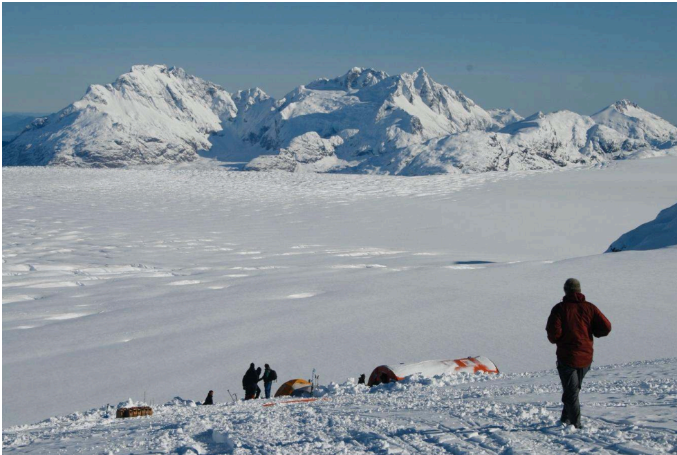
Illustration 1. L'espace montagnard comme lieu de recherche, une station scientifique sur le Champ de Glace Patagonie Nord, Parc National Laguna San Rafael 2010.