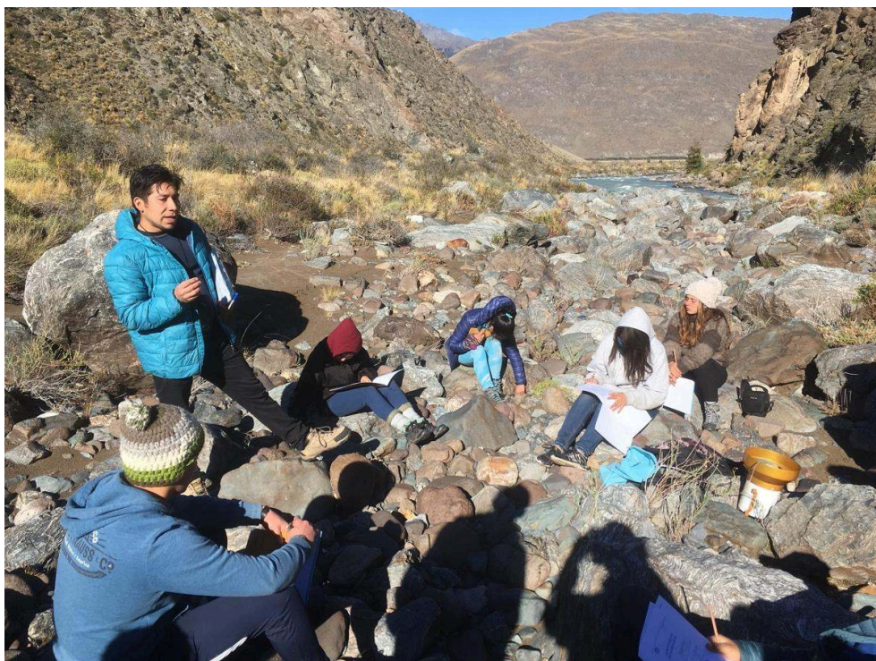
Illustration 3. L'espace montagnard comme support pour la médiation scientifique, un chercheur partage ses connaissances avec des élèves, Parc Patagonia, Aysén, en 2019.