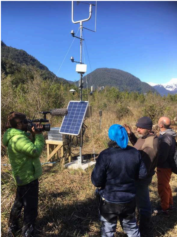
Illustration 4. L'espace montagnard comme lieu de formation pédagogique, des étudiants et professeurs prennent connaissance des infrastructures de la station scientifique Patagonia-Exploradores de l'Université Catholique du Chili, en 2019.