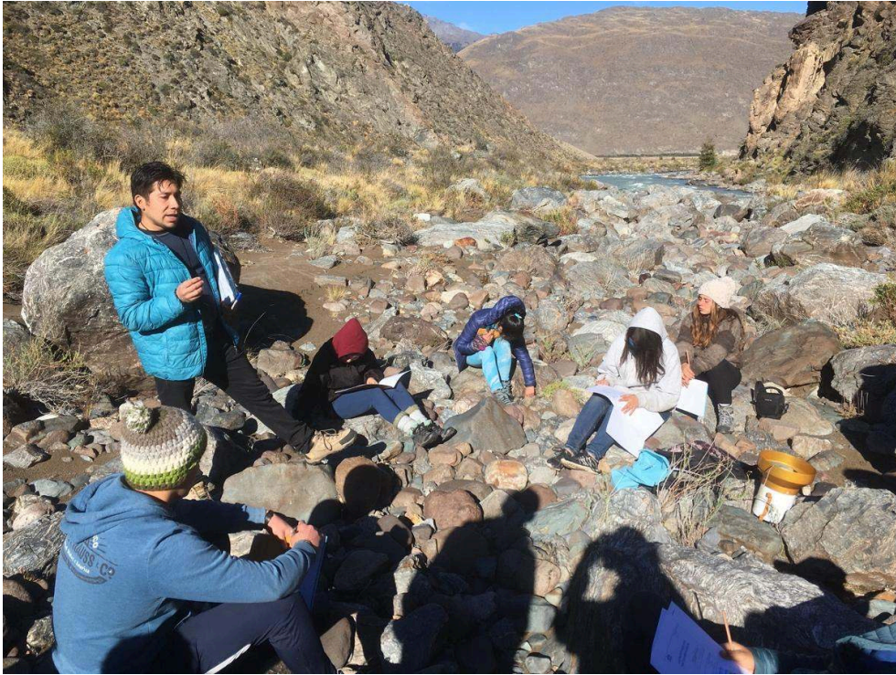
Illustration 3. L'espace montagnard comme support pour la médiation scientifique, un chercheur partage ses connaissances avec des élèves, Parc Patagonia, Aysén, en 2019.