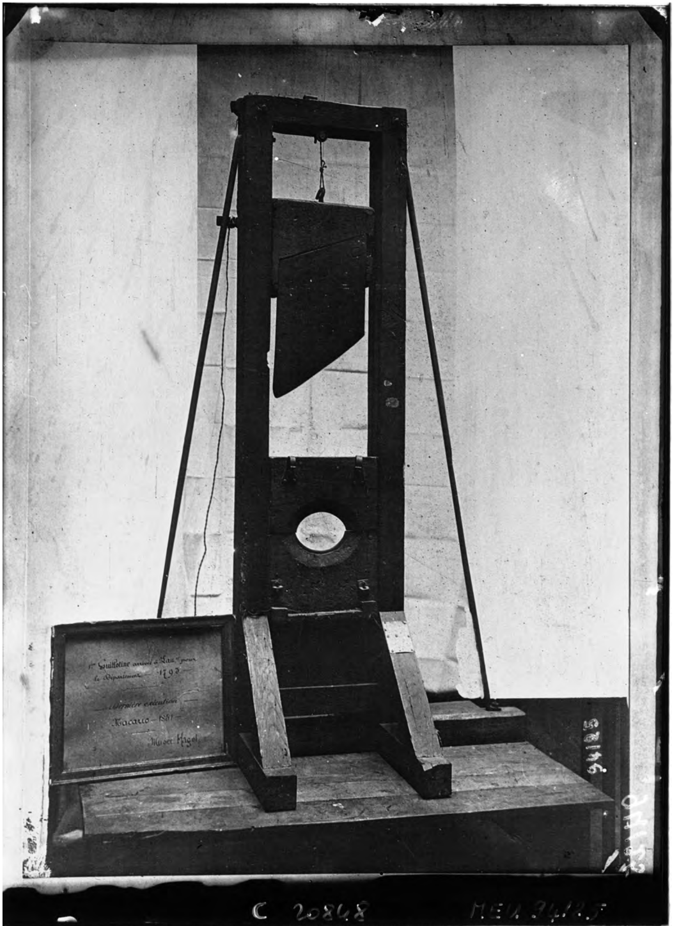
Illustration de la couverture, source : l'ancienne guillotine ayant servie jusqu'en 1848, Agence Meurisse, 1921, © Bibliothèque nationale de France.