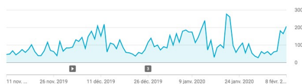
fig. 3 : pics de fréquentation deux jours avant l'examen final du 22 janvier, 277 vues le 20 janvier et 261 vues le 21 janvier.

La figure 3 illustre les pics de fréquentation la veille des contrôles qui trahissent le fait que les étudiants sont restés dans un mode de bachotage peu propice aux apprentissages durables. On peut améliorer la mesure si les capsules sont déposées dans un espace privé. Ajoutons que l'utilisation de la plate-forme YouTube peut être considérée comme étant problématique. Elle ne respecte pas nécessairement l'esprit de la RGPD, les étudiants peuvent être distraits par de l'information parasite (vidéos récréatives suggérée en panneau accessoire), les contenus étant ouverts, on ne mesure pas de façon séparée le comportement d'un établissement en particulier. En revanche, l'outil Analytics est performant et la plate-forme est très stable et disponible. Il n'entre pas dans le cadre de cette étude de comparer une plate-forme généraliste comme YouTube avec l'encapsulation de vidéos dans un CLMS comme Moodle.