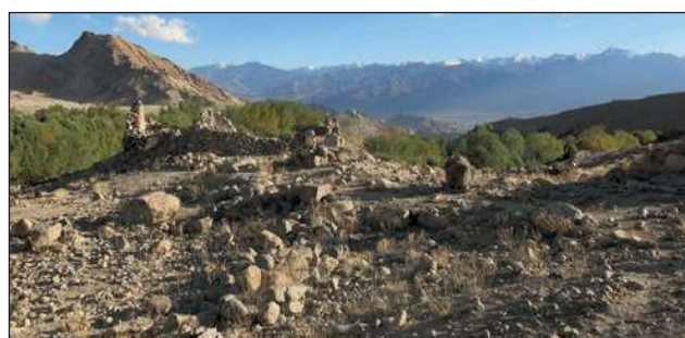
▲ Vue sur la chaîne himalayenne et le sommet de Stok Kangri (6621m) depuis le site bouddhique de Khardong Choskor (3800m), Ladakh