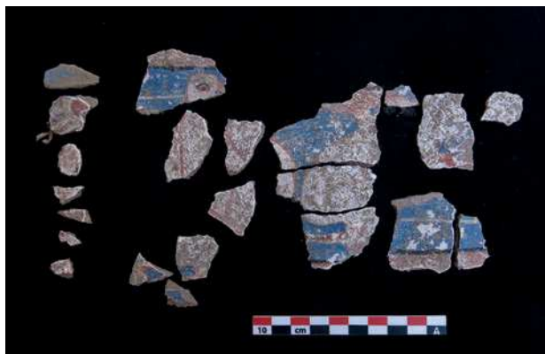
▲ Peinture murale, temple bouddhique principal du site de Khardong Choskor, 2016