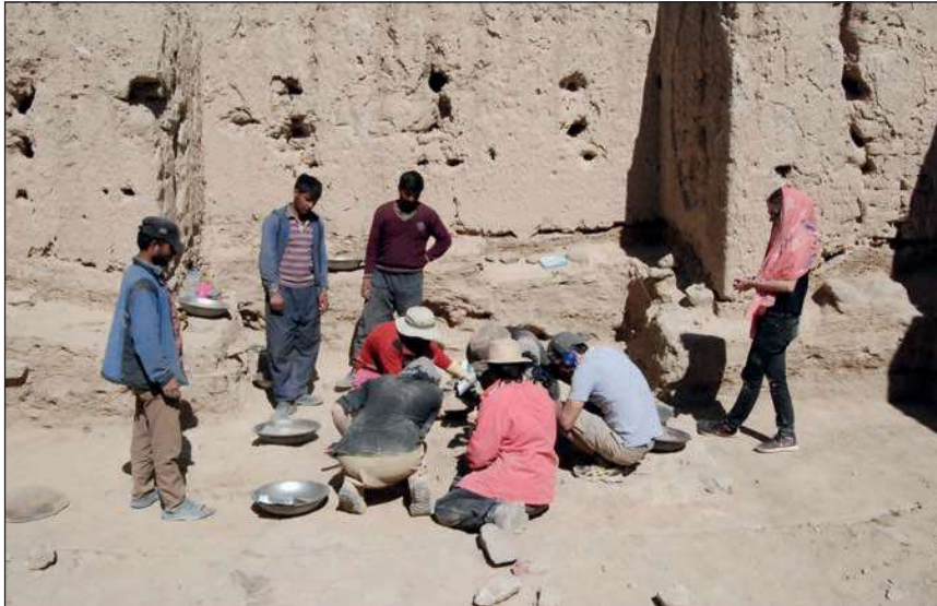
▲ Le temple bouddhique principal du site de Khardong Choskor en cours de fouilles, 2016

d'adaptation à l'altitude : la ville de Leh, où nous atterrissons, est à 3 500 m. Mener des prospections et fouiller à cette altitude est physiquement éprouvant mais scientifiquement très gratifiant. L'archéologie himalayenne est un domaine de recherche récent, qui se développe au niveau international depuis une dizaine d'années seulement et la MAFIL fait figure de projet pionnier au sein de cette discipline naissante. Cette dimension novatrice est un moteur indéniable pour les membres du projet.