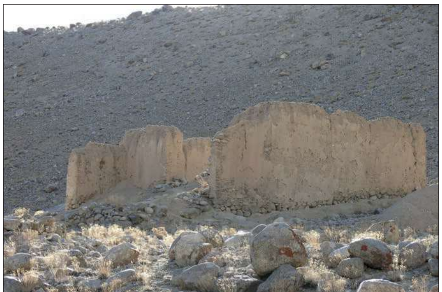
▲ Le temple bouddhique principal du site de Khardong Choskor depuis l'extérieur