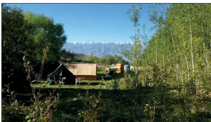
▲ Le campement de l'équipe MAFIL en 2016