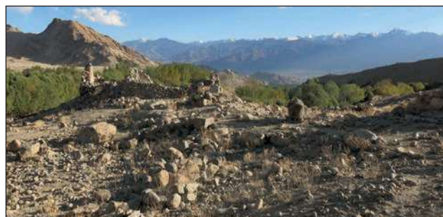
▲ Vue sur la chaîne himalayenne et le sommet de Stok Kangri (6621m) depuis le site bouddhique de Khardong Choskor (3800m), Ladakh