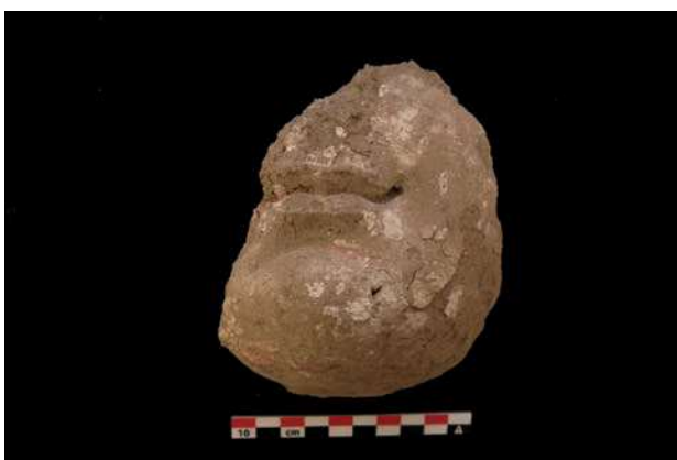
▲ Fragment de visage (terre crue peinte) d'une divinité bouddhique, temple bouddhique principal du site de Khardong Choskor, 2016