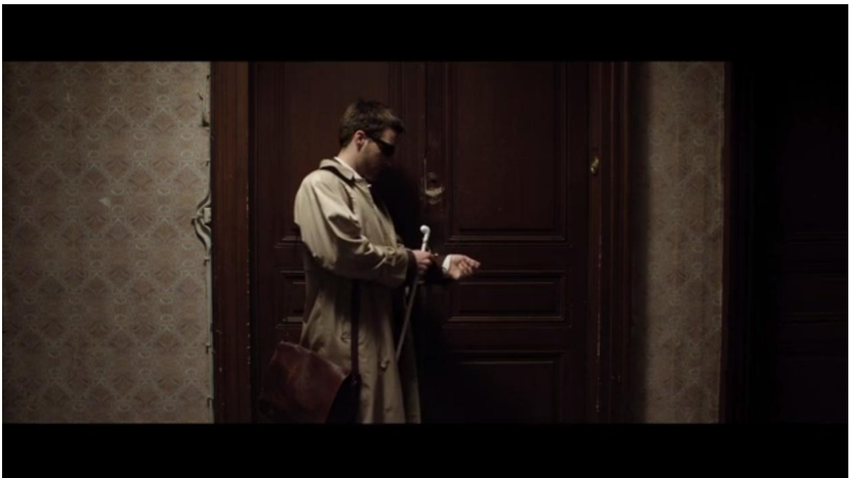
Fig. 11 – L'Accordeur , 06:35