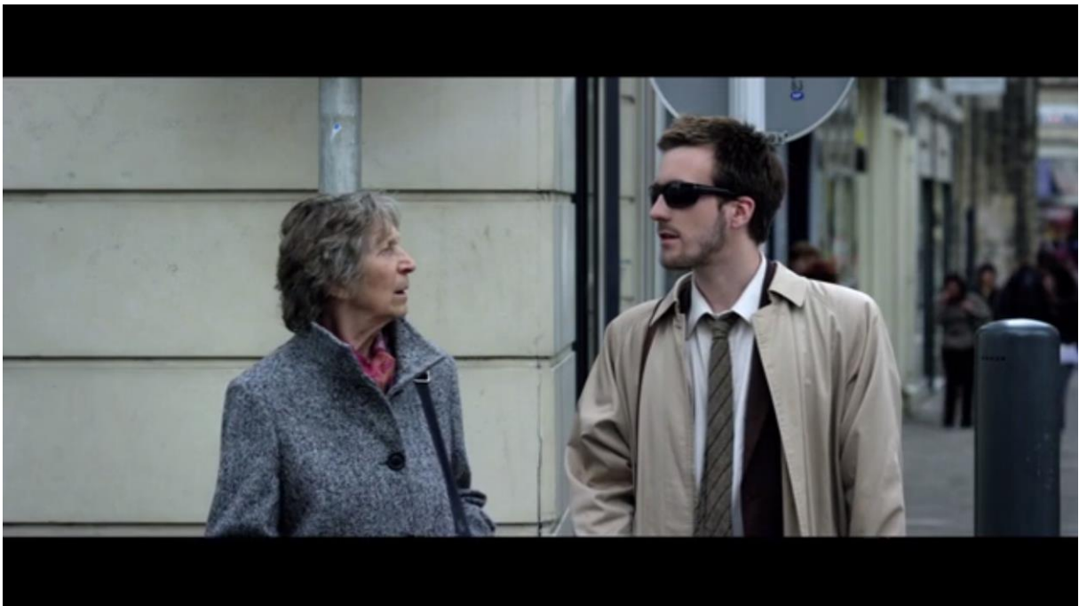
Fig. 9 – L'Accordeur , 05:55

Puis auprès de la vieille dame au moment de la traversée du passage piétons – scène évoquée plus haut :