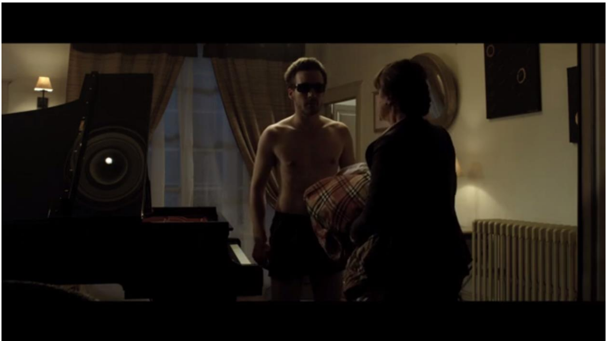
Fig. 16 – L'Accordeur , 09:14

En réponse à ces plans, le film s'achève sur un miroir panoptique qui nous permet – tenant lieu de rétroviseur spatial et temporel – de découvrir la victime précédente, la future victime, ainsi que la meurtrière et l'arme du crime 29 .