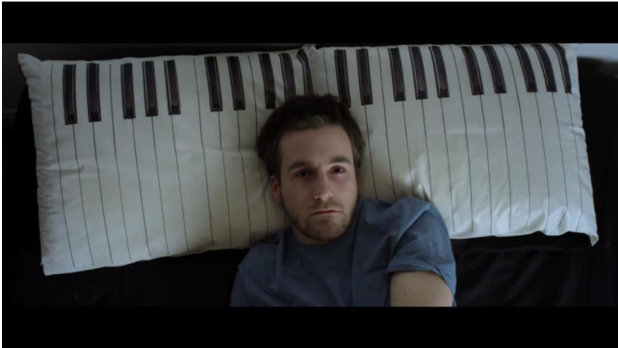
Fig. 2 – L'Accordeur , 01:32

L'autre stéréotype, et sans doute le plus commun, est celui de l'accordeur aveugle, qui constitue l'un des nœuds de l'intrigue, et le subterfuge choisi par Adrien pour subvenir à ses besoins 12 . L'image populaire de l'accordeur non-voyant s'est façonnée au XIX e siècle, notamment avec Claude Montal, accordeur et facteur de pianos lui-même frappé de cécité.