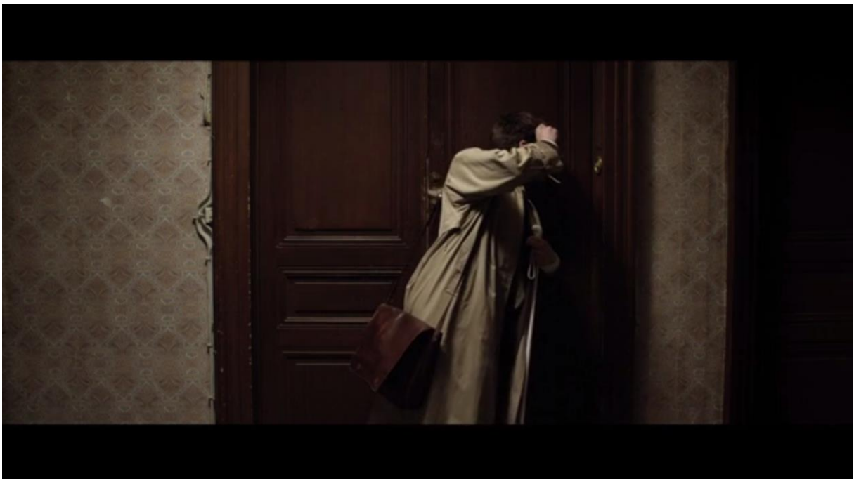
Fig. 13 – L'Accordeur , 07:02

...et même jusqu'à relever ses lunettes noires, sur le palier à l'éclairage blafard, pour s'assurer qu'il sonne à la bonne porte en inspectant le nom sur la sonnette :