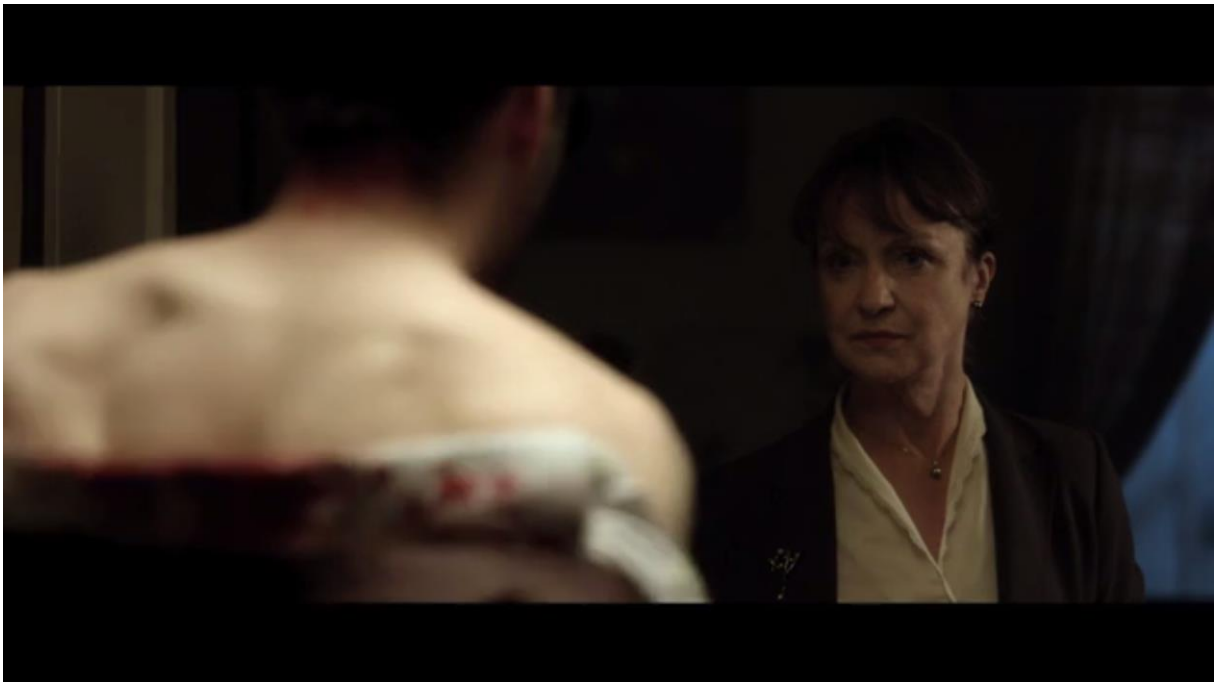
Fig. 14 – L'Accordeur , 09:00

Une fois dans l'appartement, on s'aperçoit que la femme meurtrière est aussi une menteuse, lors du strip-tease forcé d'Adrien. « Soyez tranquille, je me retourne, je ne vous regarde pas », dit-elle en le fixant ouvertement du regard :