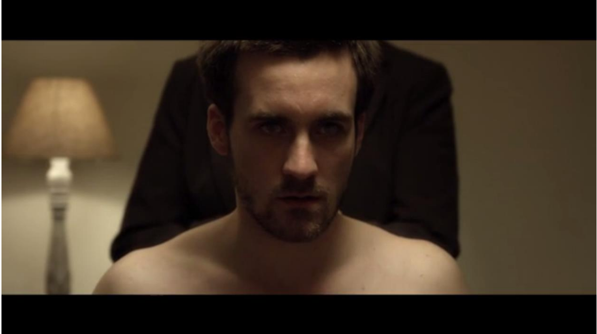
Fig. 5 – L'Accordeur , 00:50