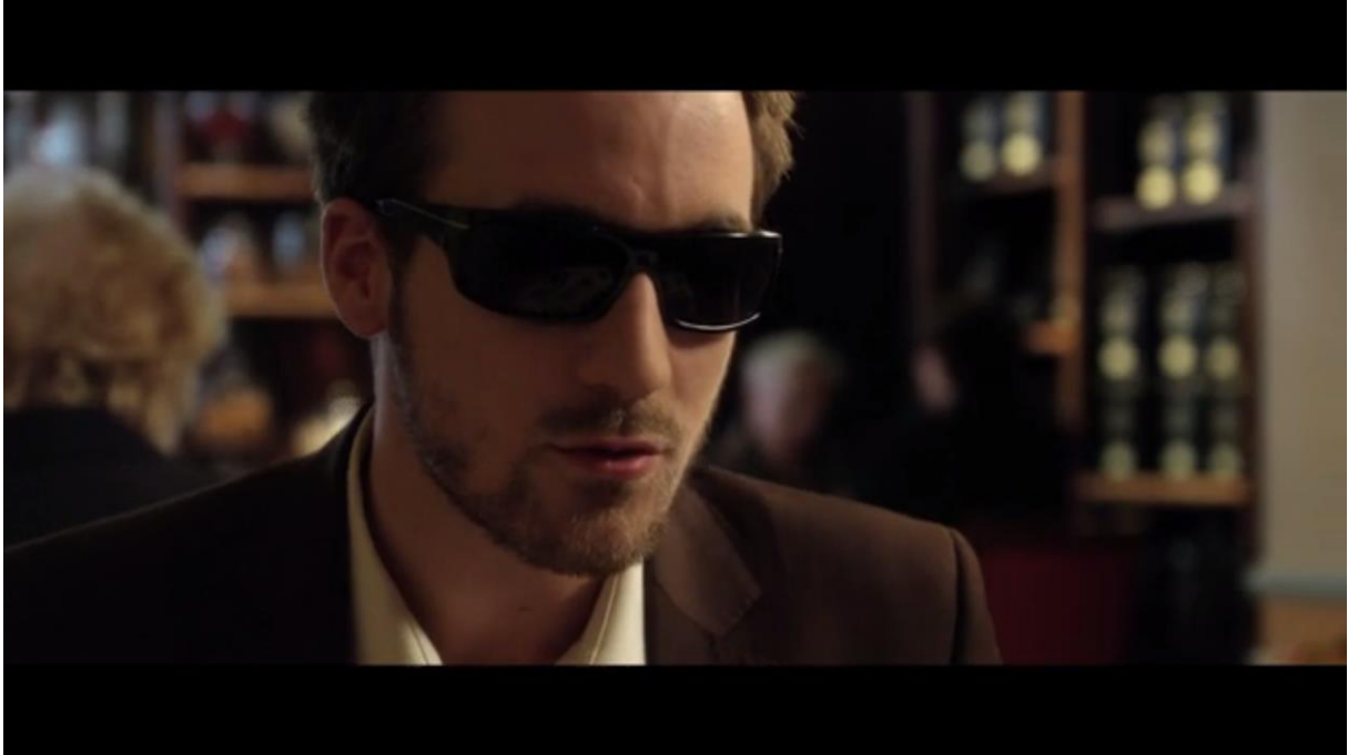
Fig. 3 – L'Accordeur , 03:35