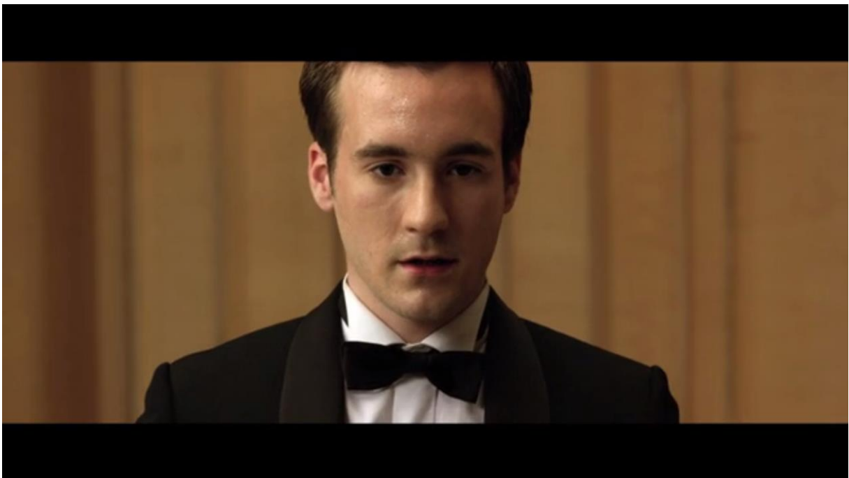
Fig. 6 – L'Accordeur , 01:24