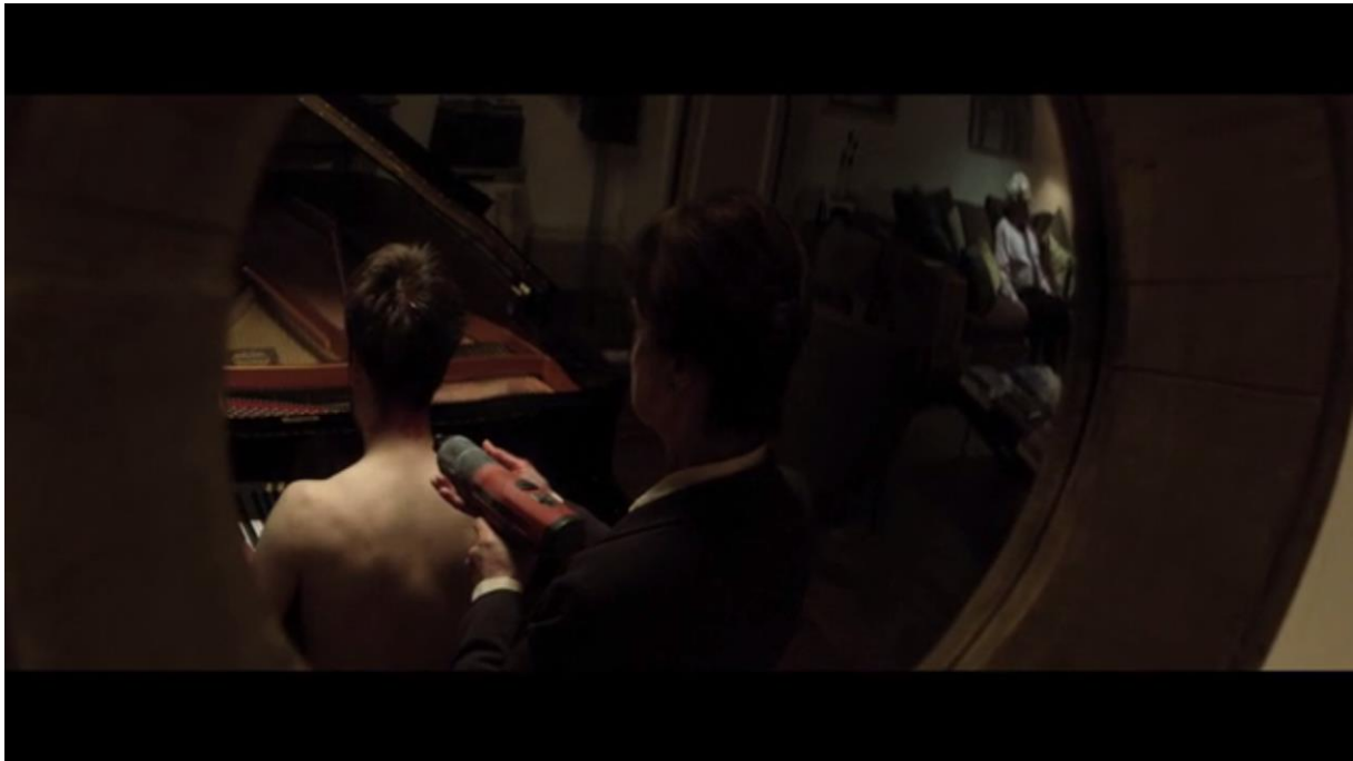
Fig. 17 – L'Accordeur , 11:44