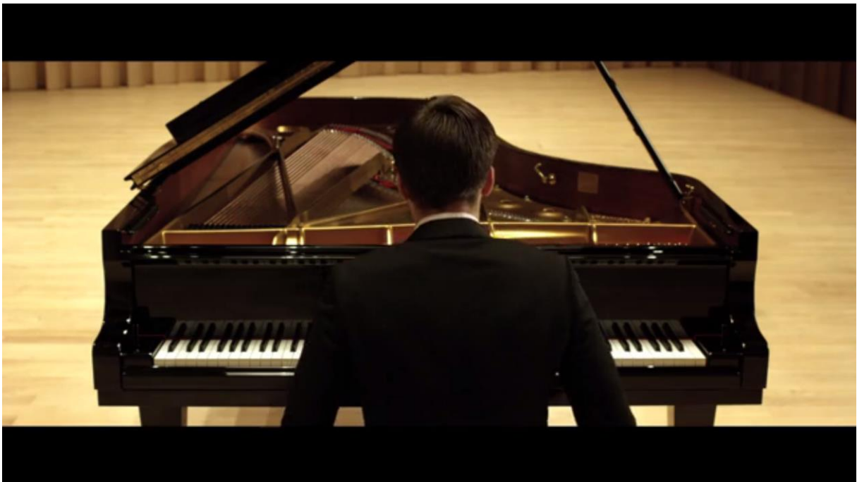
Fig. 23 – L'Accordeur , 01:14

Ces deux premiers plans se voient complétés tardivement, à la fin du film, par le plan sur les pieds, coupés par le tabouret de piano. Le corps du pianiste de dos se révèle ainsi par fragments, dans sa totalité.