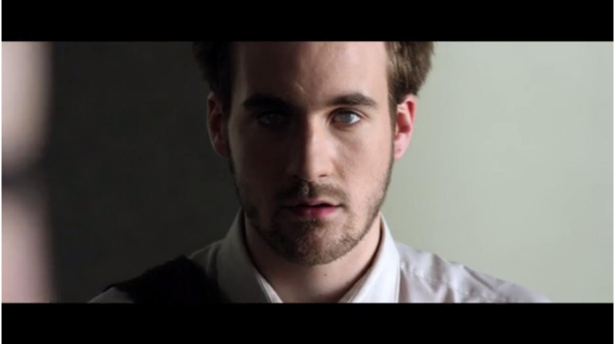
Fig. 10 – L'Accordeur , 06:28