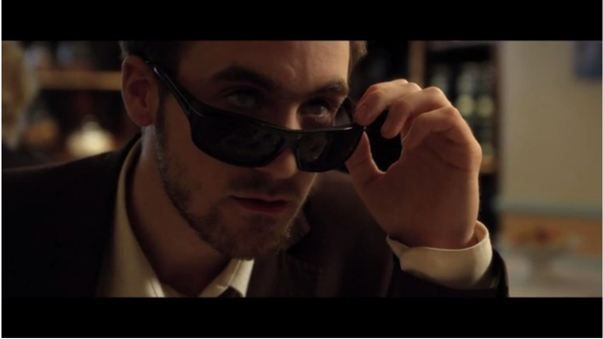
Fig. 9 – L'Accordeur , 05:09

Puis auprès de la vieille dame au moment de la traversée du passage piétons – scène évoquée plus haut :