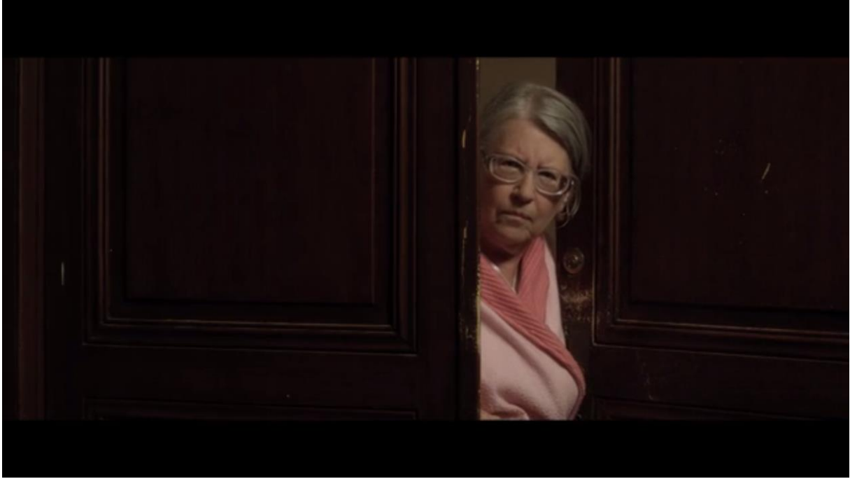
Fig. 13 – L'Accordeur , 08:03

Une fois dans l'appartement, on s'aperçoit que la femme meurtrière est aussi une menteuse, lors du strip-tease forcé d'Adrien. « Soyez tranquille, je me retourne, je ne vous regarde pas », dit-elle en le fixant ouvertement du regard :