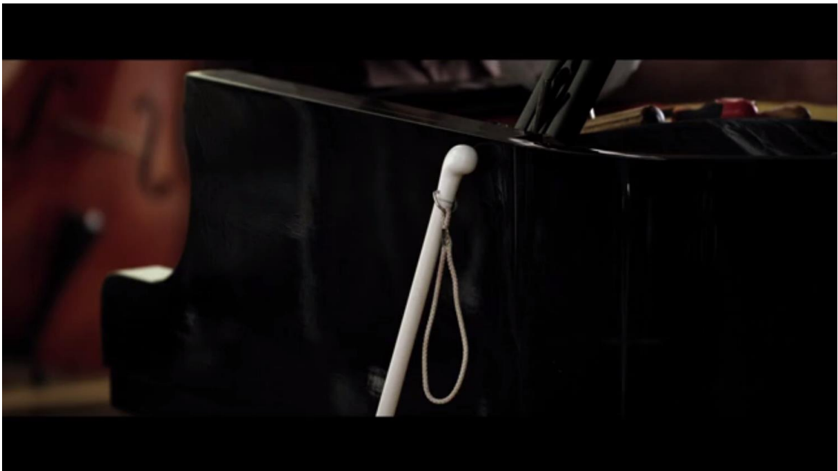
Fig. 4 – L'Accordeur , 04:26

L'accordeur aveugle connaît par la suite un certain succès, dans la littérature comme au cinéma : on le trouve par exemple chez Marcel Prévost 14 , Marcel Proust 15 , James Joyce 16 ,