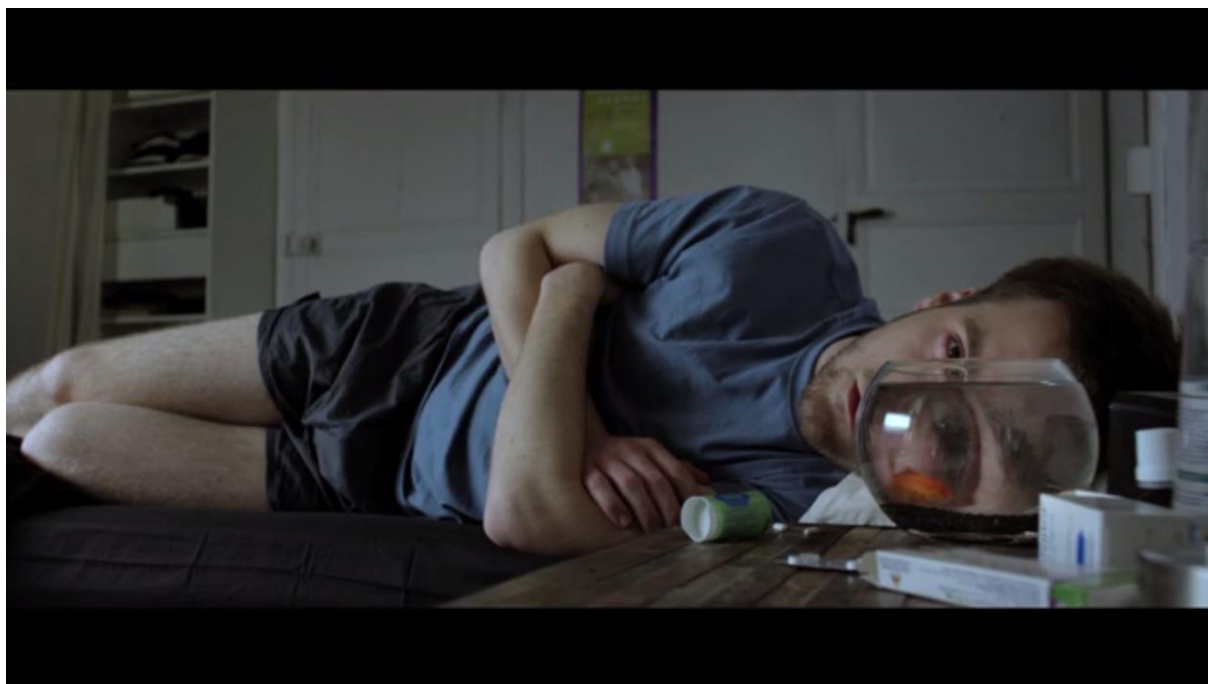
Fig. 7 – L'Accordeur, 01:42

...et enfin déformé, un œil dans le bocal du poisson rouge 25 :