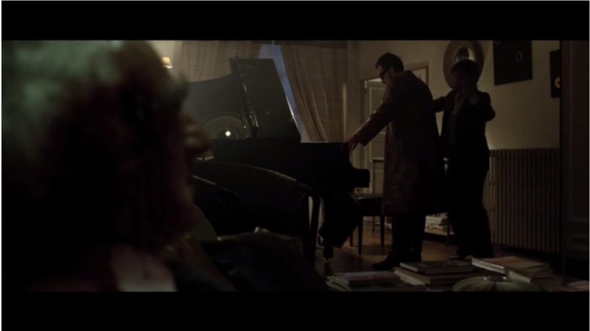
Fig. 15 – L'Accordeur , 08:33

centre du cadre et nous révèle l'ensemble des protagonistes ; la deuxième fois, il apparaît sur la gauche, dans sa circularité parfaite.