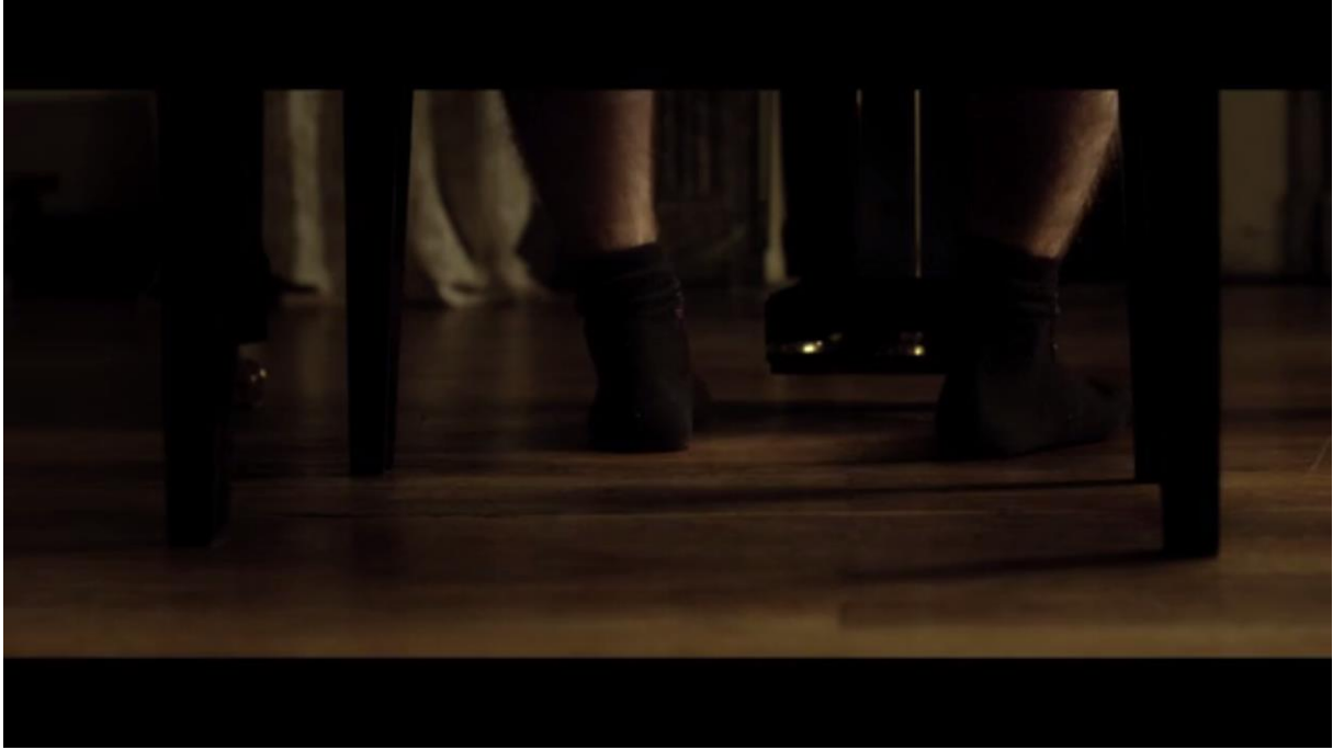
Fig. 24 – L'Accordeur , 10:16

Or cette position est celle de la meurtrière, dont on voit juste après, sur le même plan, les pieds entrer dans le champ – nous avons déjà entendu ses pas. La dernière apparition de la voix off (à partir de 11:11) nous ramène à la fable et au conte, car en ultime recours, Adrien s'en remet aux capacités ensorcelantes et magiques de la musique (même si la répétition de la dernière phrase se termine sur une intonation ascendante, indiquée ici par un point d'interrogation entre crochets, qui dénote un doute ou une hésitation) :