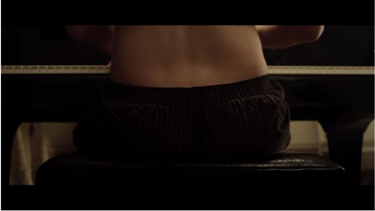
Fig. 22 – L'Accordeur , 00:38