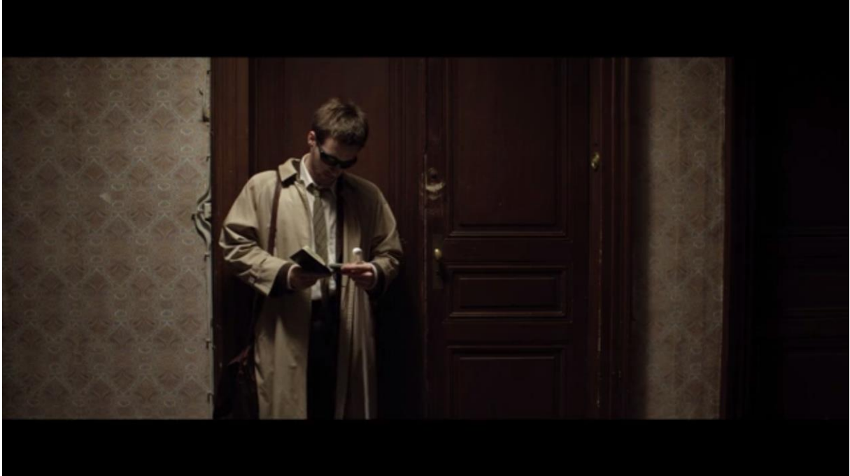
Fig. 12 – L'Accordeur , 06:56

...et même jusqu'à relever ses lunettes noires, sur le palier à l'éclairage blafard, pour s'assurer qu'il sonne à la bonne porte en inspectant le nom sur la sonnette :