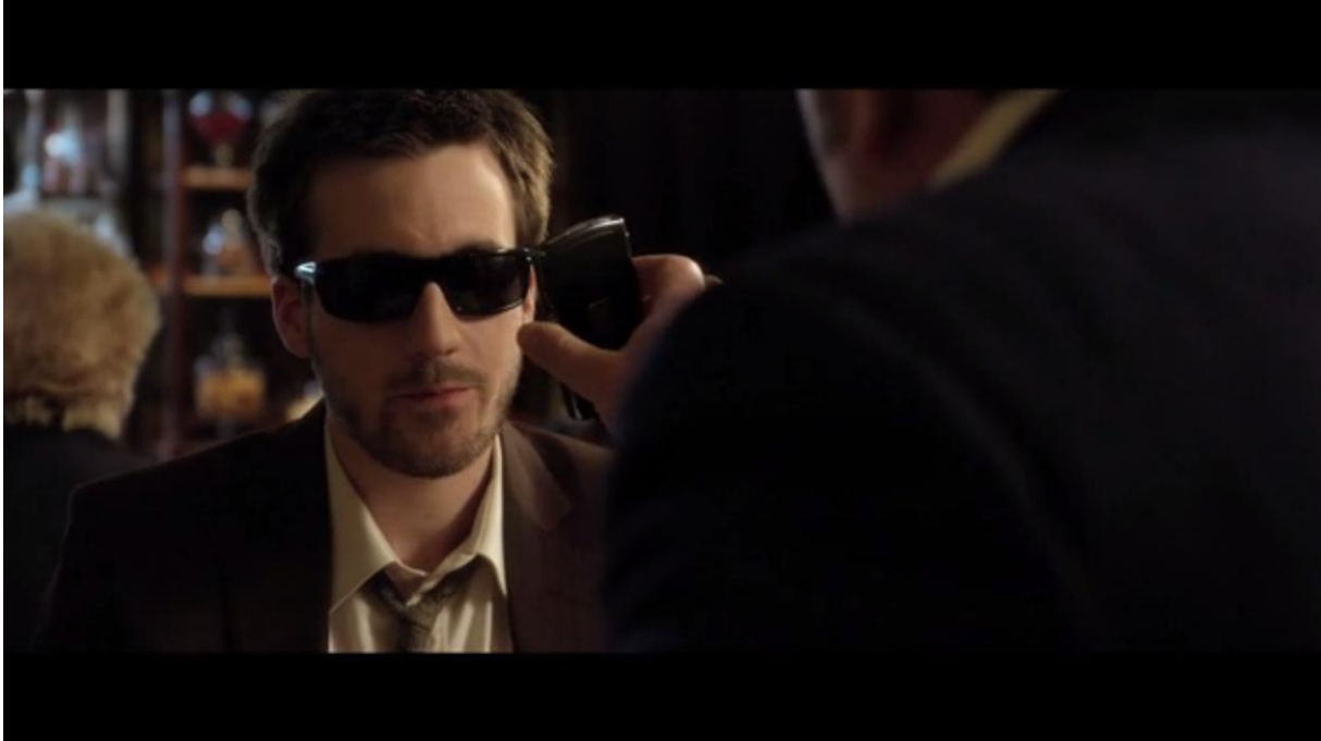
Fig. 8 – L'Accordeur , 02:06

Ensuite, le réalisateur suscite la frustration lors d'un cut brutal (04:39) au moment où Adrien profite (et nous aussi, par la même occasion, même si le corps flou de la danseuse n'est jamais visible que par fragments) de la contemplation de la danseuse répétant en petite tenue.